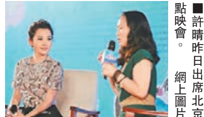
許晴昨日出席北京點映會。

音,她是故意的嗎?」兩季《花兒與少年》的導遊分別由張翰及鄭爽擔任,與這對曾經的眷侶隔時空相識,許晴自歎:「是一種緣分」。在這次旅行中,許晴更大讚鄭爽是個特別可愛的90後妹子,有很多私房話要聊。與兩季導遊都有交集的許晴,對於「許晴曝張翰鄭爽戀情內幕」的新聞也是有話要說,她表示:「我認為任何感情都應該是大家尊重的,兩個人現在各自已經有各自的生活,是應該祝福的。」