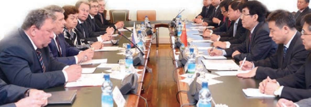
■吉林省代表團與俄羅斯遠東鐵路局舉行工作會談。