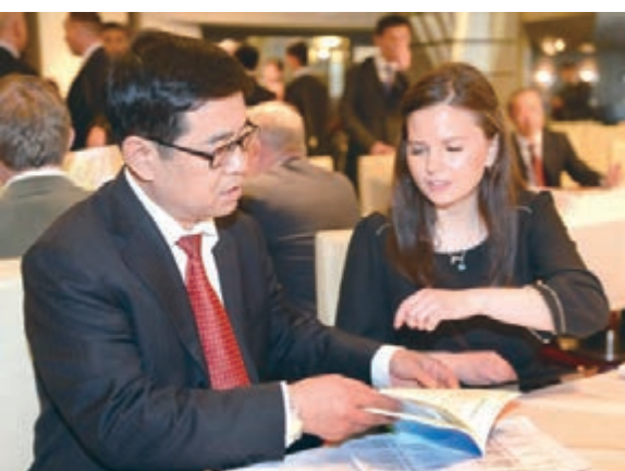
■吉林省代表團在俄羅斯進行友好訪問。

濱海邊疆區副州長烏索利采夫在致辭中表示，濱海邊疆區與吉林省經濟互補性強、產業關聯度高，合作前景十分廣闊。希望雙方本着優勢互補的原則，深化交流合作，促進共同發展，開創合作新天地。