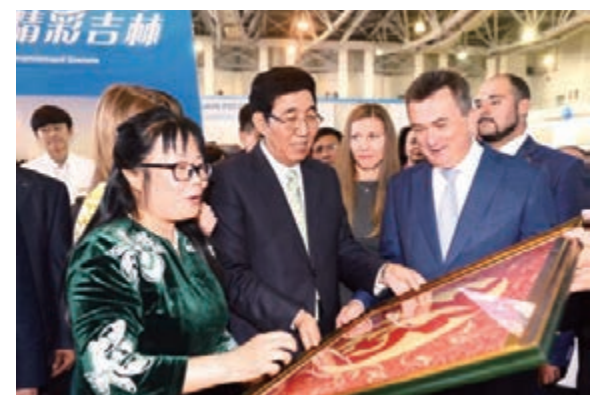
■第十九屆太平洋國際旅遊博覽會在俄羅斯開幕，吉林省委書記巴音朝魯和濱海邊疆區州長米克盧舍夫斯基參觀吉林展區。

在園區的農業種植基地，陪同考察的濱海邊疆區什克沃區區長尤里向巴音朝魯介紹了俄方對吉林投資項目的相關政策，對吉林企業務實務抓的項目精神表示讚歎。巴音朝魯感謝什克沃區政府對吉林企業的支持，希望他們在勞務准入、融資政策等方面提供便利條件，推動企業快速發展。他叮囑企業要遵守當地法規，尊重當地風俗，充分利用自身優勢和條件，為當地經濟發展作貢獻。