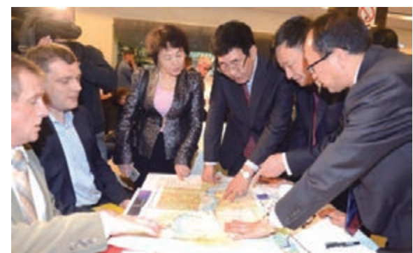
■吉林省委書記巴音朝魯向正在洽談的中俄雙方企業代表詳細了解項目情況。