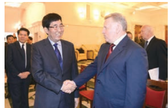
■吉林省委書記巴音朝魯會見俄羅斯哈羅夫斯克邊疆區州長什波爾特。

巴音朝魯指出，近年來，在習近平主席和普京總統的共同推動下，中俄兩國戰略協作夥伴關係提升到前所未有的高度。此次吉林代表團訪問俄羅斯，就是深入貫徹中俄兩國元首5月8日在莫斯科會晤期間達成的重要共識，進一步落實推進絲綢之路經濟帶建設同歐亞經濟聯盟建設對接，推動中俄地方合作向廣度和深度發展。吉林省是國家重要的老工業基地和商品糧基地，