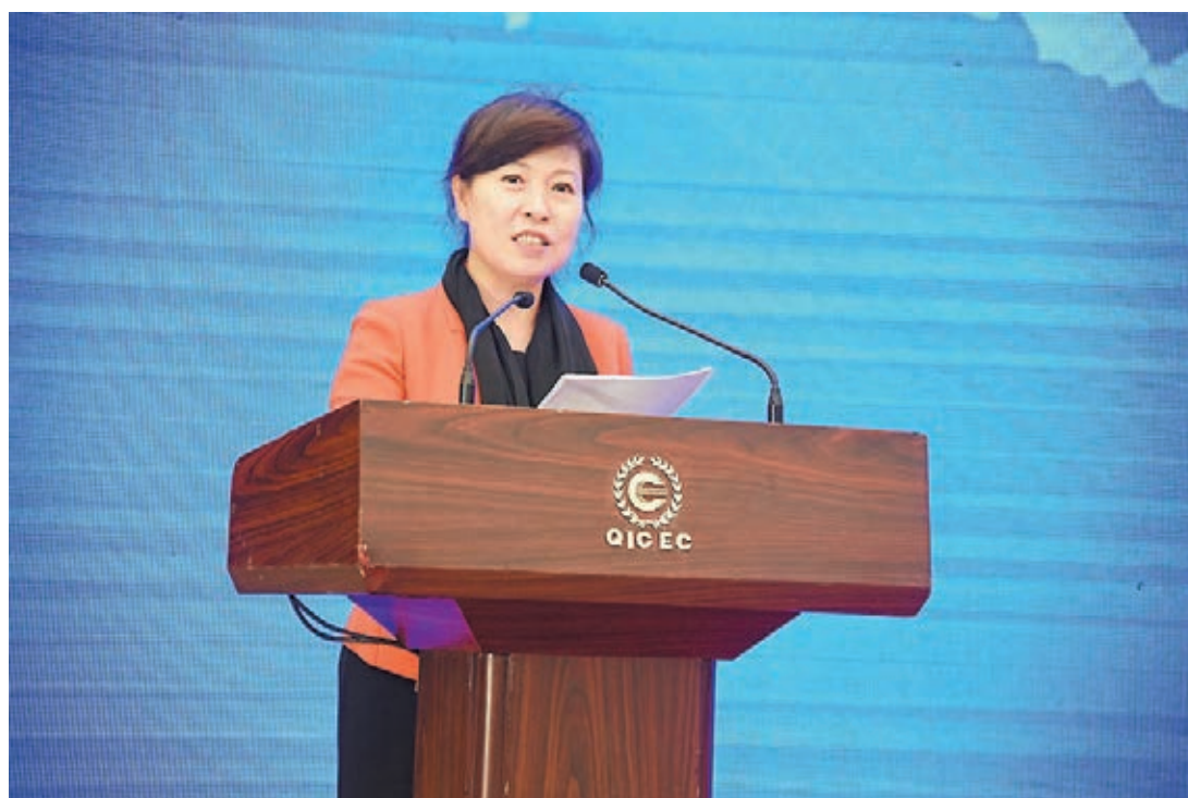
■陝西省副省長王莉霞。

香港文匯報訊(記者 張仕珍 西安報道) 2015中國(西安)跨境電子商務交流會早前召開。隨着以互聯網、雲計算、物聯網為代表的訊息技術不斷突破，陝西省積極鼓勵電商創業創新，引導傳統企業「觸電」，去年電子商務交易額已超過2,180億元(人民幣，下同)。