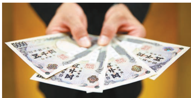
■圓匯持續走疲，有助吸引資金流入，推動日本旅遊及出口表現。 資料圖片