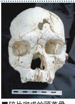
碎片砌成的頭蓋骨

考古學家用3D造影等鑑證技術，檢測過去20年發現的52片頭骨碎片，發現在左眼上方有兩處凹入的損傷，由同一個物件造成，相信死者是被人用木槍等武器殺死。參與研究的西班牙進化學及人類行為聯合中心專家薩拉表示，最新發現顯示早在「更新世」中期，人類社會已存在謀殺行為。發現人骨的遺址位於西班牙北部地下洞窟系統內，由於洞窟只有一條13米深豎井通向外界，專家認為死者可能是意外墜入或死後被棄屍洞內。