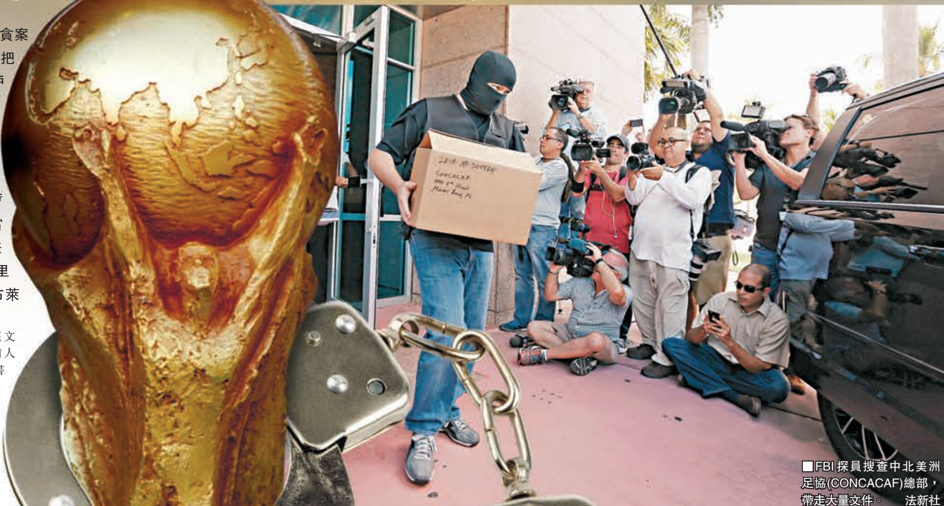
FBI探員搜查中北美洲足協(CONCACAF)總部，帶走大量文件。法新社