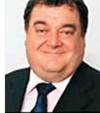
前開曼群島總秘書長塔卡斯

英國《金融時報》指，部分銀行近年已因洗黑錢被罰款，事件或再度令華爾街成為焦點。美國國稅局(IRS)刑事調查部門主管韋伯指，涉案人士有複雜的洗錢機制，形容案件是「欺詐世界盃」，要向FIFA「出示紅牌」。