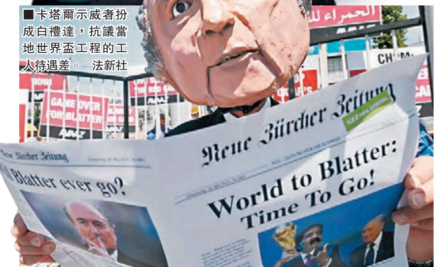
卡塔爾示威者扮成白禮達，抗議當地世界盃工程的工人待遇差。