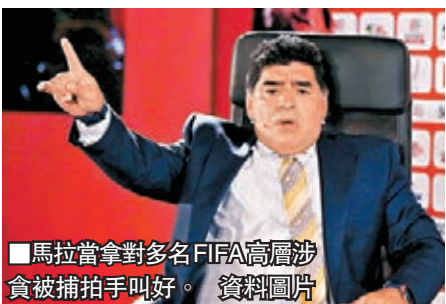
馬拉當拿對多名FIFA高層涉貪被捕拍手叫好。資料圖片