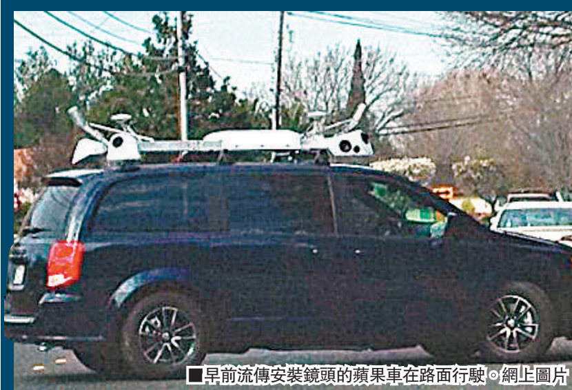
早前流傳安裝鏡頭的蘋果車在路面行駛。網上圖片