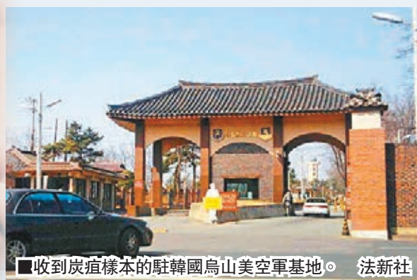
收到炭疽樣本的駐韓國烏山美空軍基地。

美國軍方發生嚴重失誤事故，國防部前日證實，位於猶他州的軍方實驗室誤把炭疽桿菌樣本，分別送往9個州份及駐韓國烏山美空軍基地的實驗室，4名美國實驗室人員及韓國基地22人因可能接觸炭疽菌，而要接受注射抗生素和疫苗等預防性治療。暫時未清楚出錯原因