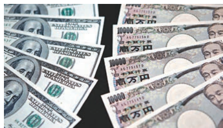
日圓兌美元曾觸及124.39水平。

美國本周公布的多項經濟數據好過預期，令市場進一步預期聯儲局會於今年內加息，美元持續強勢下，日圓匯價低處未