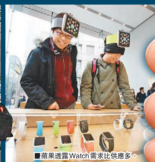
蘋果透露Watch需求比供應多。