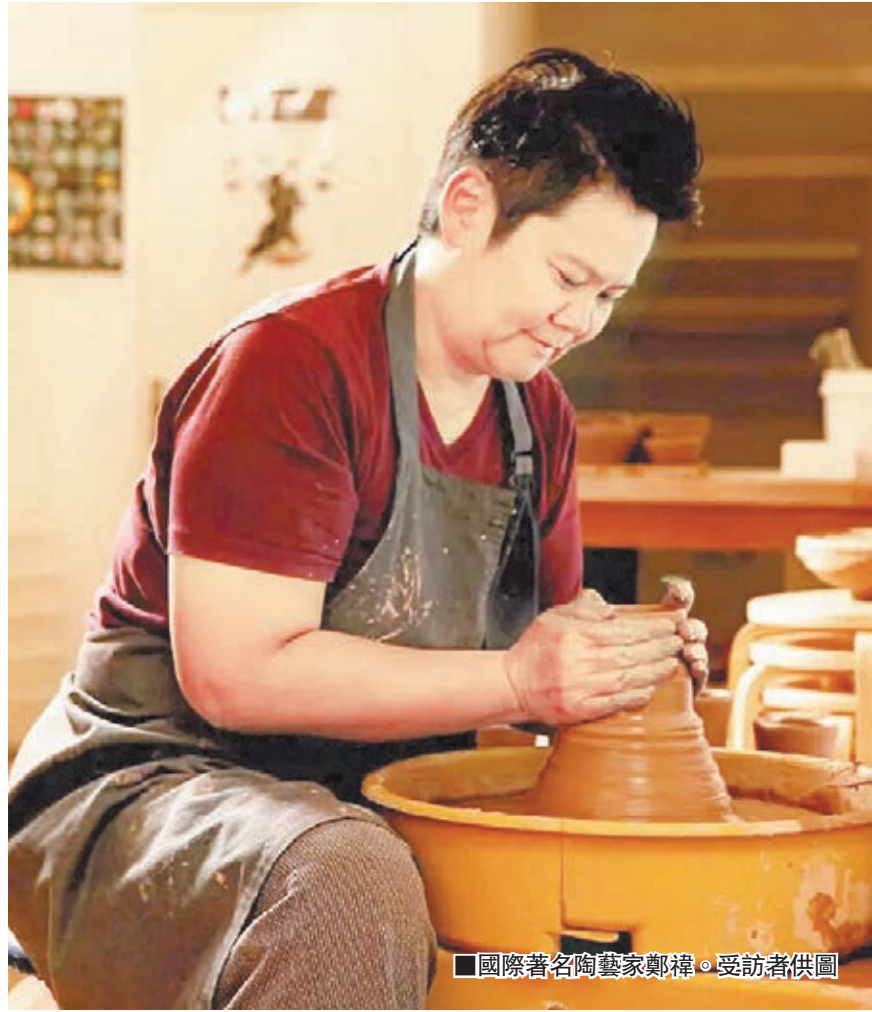
國際著名陶藝家鄭禕。

在香港、紐約、上海、北京、江西景德鎮時的鄭禕是一位國際著名陶藝家，而在雲南大理的她，是一個會享受的生活家。做得一手好菜的鄭禕常說：「做菜和陶藝是相通的，講究創意和搭配，所以生活和藝術也是融會貫通的。」她將對大理的熱愛全部投入到保護當地環境的行動中，希望大理能變得更加美好。