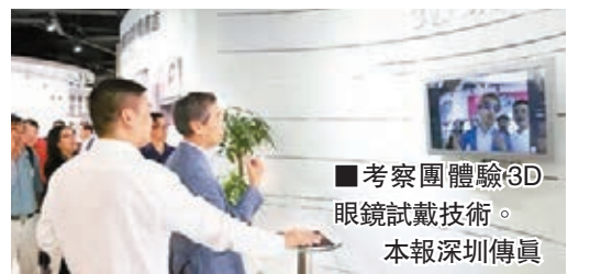
考察團體驗3D眼鏡試戴技術。本報深圳傳真

香港文匯報訊（記者 羅珍，特約通訊員 蔣小平 深圳報導）香港中華眼鏡製造廠商會一行30餘人近日來到深圳橫崗，參觀考察橫崗眼鏡發展狀況，並在相關領域展開交流與合作。