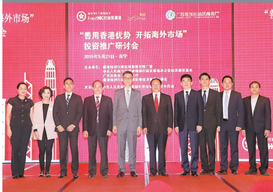
投資推廣署近日在南寧舉辦投資推廣研討會，以鼓勵廣西企業借助香港優勢拓展海外市場。本報廣西傳真

香港文匯報訊（記者 曾萍 廣西報導）香港特別行政區政府投資推廣署近日在南寧舉辦投資推廣研討會，該研討會以「善用香港優勢，開拓海外市場」為主題，鼓勵廣西企業以香港為平台拓展海外市場。