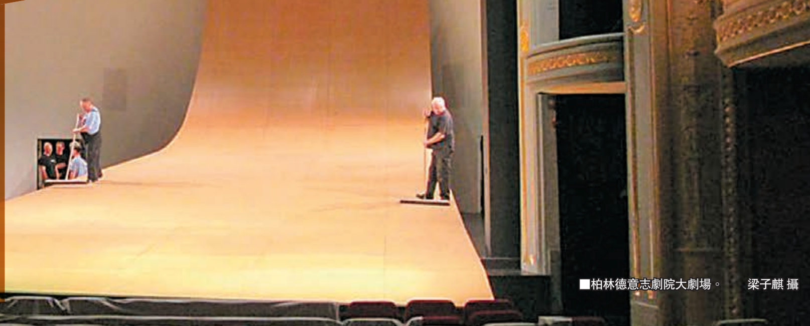
柏林德意志劇院大劇場。

不久前，一封僅有十個字的辭職信在網絡上爆紅，遞信者一句「世界很大，我想出去走走」，道出了營營役役人生對廣闊未知的無限嚮往。世界真的很大，為了更好地向外吸取經驗以制定策略、拓展觀眾，促使香港藝術整體同步發展，西九文化區管理局（西九）與香港藝術發展局（藝發局）合辦「本地藝團領袖人才海外考察及培訓計劃」，委派本港藝團代表出去走走。五名計劃參與者，在旅途中不但提升了個人實務知識及技能，開拓了國際網絡，而且還根據考察所獲得的經驗和知識，為香港藝術以及西九的發展方向提出了寶貴的建議。 文：香港文匯報記者 趙偉