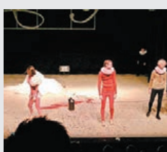
80%以上德國劇場都以經典劇本、小說為原材料做改編工作，新劇反而少見，此為柏林列寧廣場劇院演出的「混身是血」版本的《羅密歐與朱麗葉》。