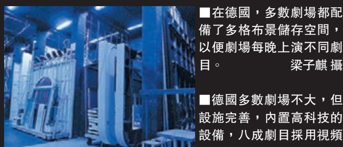
在德國，多數劇場都配備了多格布景儲存空間，以便劇場每晚上演不同劇目。