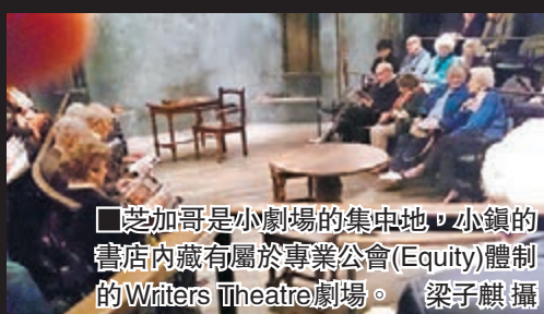
芝加哥是小劇場的集中地，小鎮的書店內藏有屬於專業公會(Equity)體制的Writers Theatre劇場。