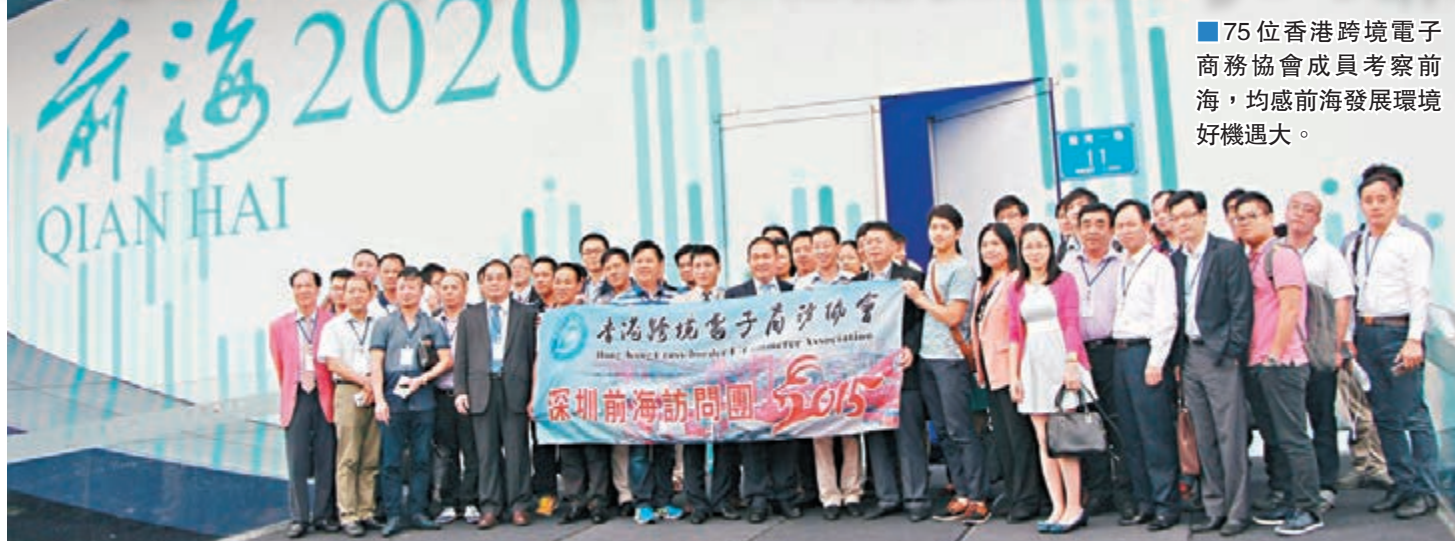
75位香港跨境電子商務協會成員考察前海，均感前海發展環境好機遇大。