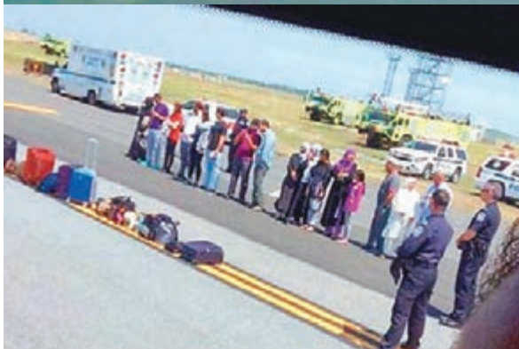
乘客下機後接受安檢。