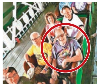
克萊曼(紅圈者)是「傑克兔」擁護者。