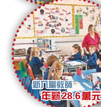
新入職教師 年新28.6萬元

寵物保險公司Direct Line調查顯示，專業放狗員平均時薪是11.5英鎊(約137港元)，較英國最低工資逾七成，假設每日工作8小時，一個月合共放狗192次，年薪可達2.6萬英鎊，高過英國人平均年薪2.2萬英鎊(約26萬港元)。