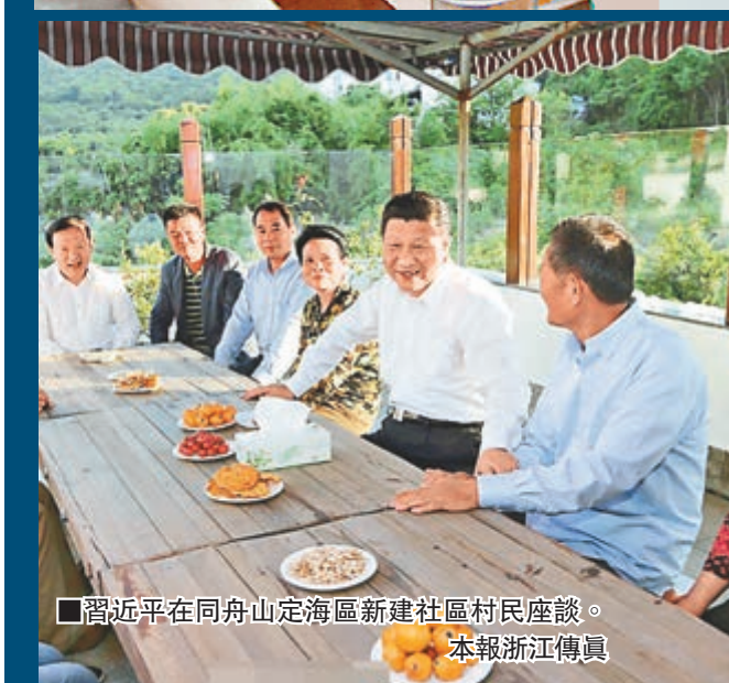
■習近平在同舟山定海區新建社區村民座談。本報浙江傳真