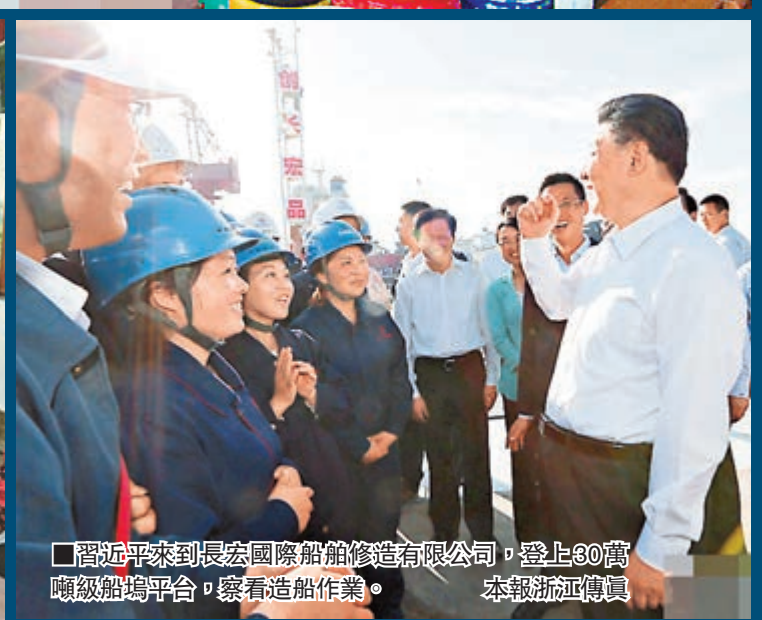
■習近平來到長宏國際船舶修造有限公司，登上30萬噸級船塢平台，察看造船作業。本報浙江傳真