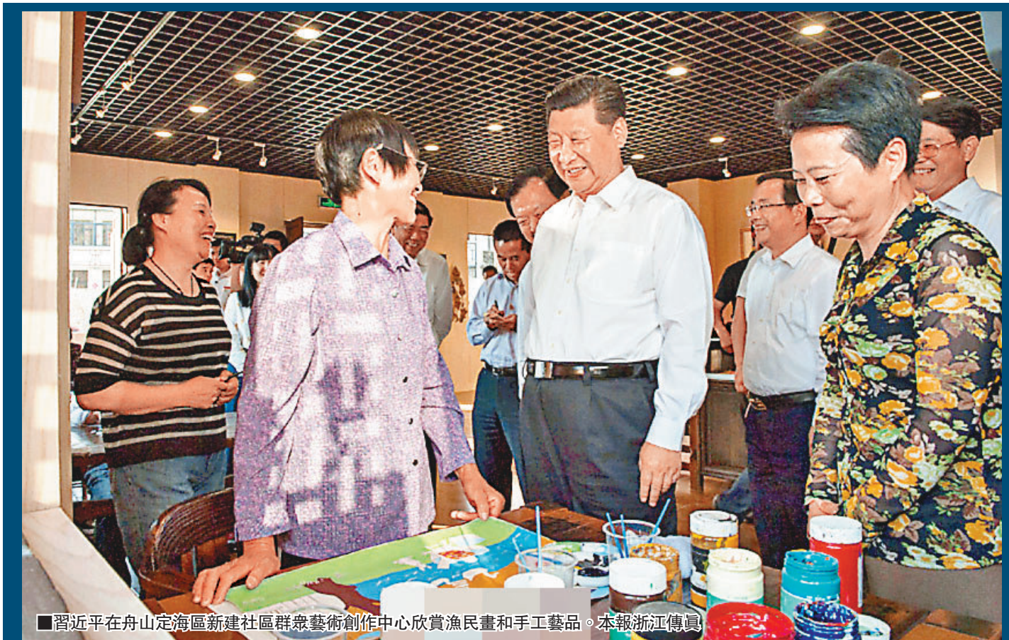
■習近平在舟山定海區新建社區群眾藝術創作中心欣賞漁民畫和手工藝品。

去年以來，杭州陸續關閉轉型西湖周邊30家會所，實現還湖於民。在杭州城市規劃展覽館聽取西湖周邊會所整治工作匯報時，習近平指出：「公共資源不能為少數人壟斷享用，更不能搞不正之風，敗壞社會風氣。」