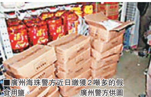
■廣州海珠警方近日繳獲2噸多的假食用鹽。

香港文匯報訊（記者 敖敏輝 廣州報道）記者從廣州市公安局獲悉，近期，廣州海珠警方開展打擊銷售假食用鹽專項行動，成功打掉6個銷售假食用鹽窩點，抓獲8名銷售假食用鹽的疑犯，繳獲4,000多包、共2噸多的假食用鹽。