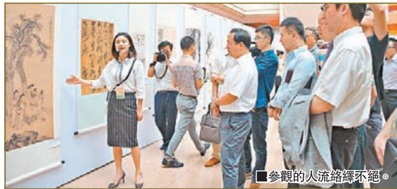
■參觀的人流絡繹不絕。