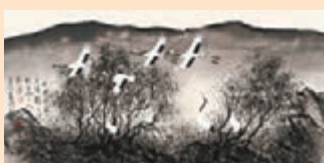
■高譯作品：天地自然系列