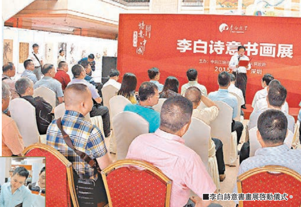
■李白詩意書畫展啓動儀式。

「李白不僅是中國的偉大詩人，也是一位世界文化名人。」郭興隆介紹，作為李白故里，一方面，竭力保護、傳承李白文化，另一方面，加大力度讓李白文化「走出去」。