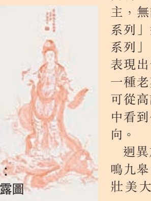
■末白作品：乘龍觀音施露圖

水、觀音表達文人情懷的「念天地之悠悠，獨愴然而涕下」和慈悲情懷，筆墨簡約而內斂，更多的表現出「老莊」的隱世情懷。