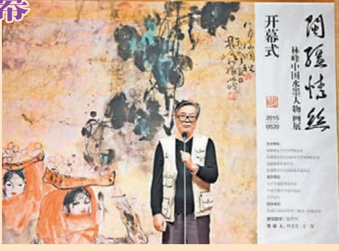
■林峰在畫展開幕式中致辭

畫展由福建省文學藝術界聯合會、新疆維吾爾自治區文學藝術界聯合會等主辦，北京東城美術家協會等協辦，展覽於中國美術館二、四展廳展出至6月1日，市民可免費欣賞。中國美術館館長范迪安、中國美術家協會會員，九洲書畫藝術研究會會長張廣志等多名社會各界人士和業內人士出席主禮致賀。