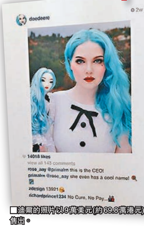
迪爾的照片以9萬美元(約69.8萬港元)售出。