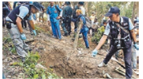
警方發現約30個亂葬崗，埋葬了數百具屍體。

馬來西亞內政部長扎希德昨日表示，在接壤泰國南部的邊境城市發現多個亂葬崗，位置接近人蛇集團棄置的偷渡營地，死者可能是緬甸羅興亞人和孟加拉人。當地報章報道，警方發現約30個亂葬崗，埋葬了數百具屍體。