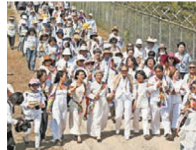
女權分子趁昨日「國際婦女裁軍日」穿越非軍事區。

一批來自全球各地的女權活躍分子趁昨日「國際婦女裁軍日」，由朝鮮穿越非軍事區前往韓國，希望推動朝鮮半島和平與和解，並希望朝韓離散家屬終有一天能團聚。