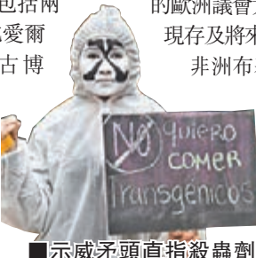
示威者頭直指殺蟲劑「Roundup」。