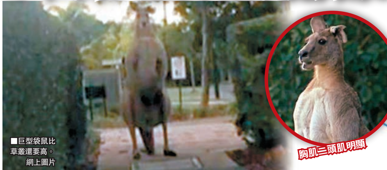
巨型袋鼠比草叢還要高。網上圖片

澳洲袋鼠數目近年劇增，在社區中出現早已見慣不怪，不過布里斯班出現一隻2米高的巨型袋鼠，牠身形健碩，估計重達95公斤，胸肌及二頭肌線條明顯，居民見到都不敢行近。然而這隻誤闖民居的袋鼠似乎同樣驚惶，見到狗隻即嚇得不敢動彈。