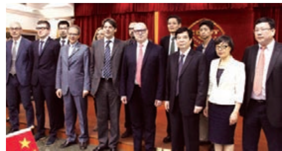
意大利艾米利亞—羅馬涅大區主席斯丹法諾·波那奇尼、外辦主任兼米蘭世博會相關事務負責人魯本·撒切爾多蒂一行拜會廣東省貿促會。

2014年12月5日至7日，米蘭世博會組委會與米蘭世博會中國館組委會共同主辦，廣東省貿促會承辦的2015年意大利米蘭世博會中國路演廣州站在廣州成功舉辦。路演活動為期三天，除開幕式外，還舉辦了意大利米蘭世博之夜、中意B2B交流座談會以及「亞振之夜」晚會等豐富多彩的活動，同時還有意大利美食、藝術等展覽展示，讓廣