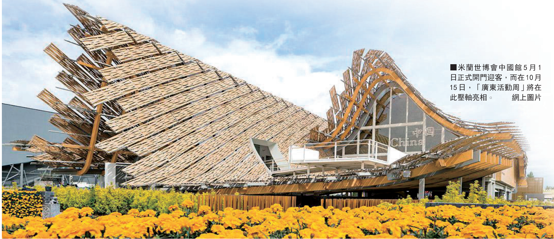
米蘭世博會中國館5月1日正式開門迎客，而在10月15日，「廣東活動周」將在此壓軸亮相。