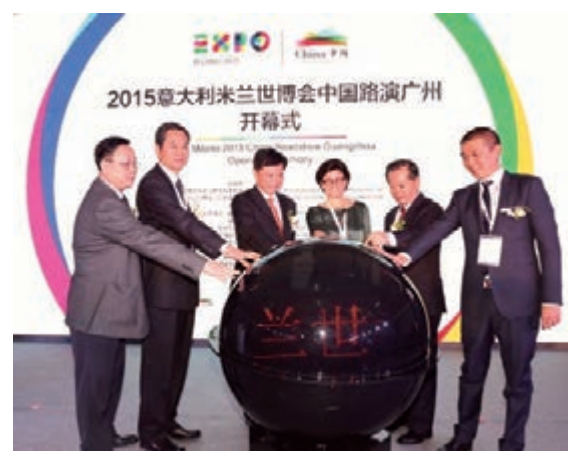
2015米蘭世博在廣州啟動路演活動。