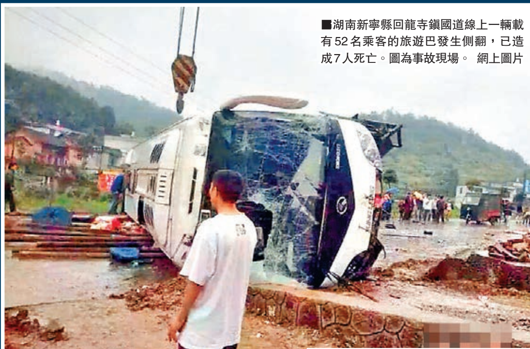
湖南新寧縣回龍寺鎮國道線上的一輛載有52名乘客的旅遊巴士發生側翻，已造成7人死亡。圖為事故現場。

香港文匯報訊（記者 董曉楠 湖南報道）昨日上午11時40分左右，一輛從湖南長沙開往邵陽新寧崗山的旅遊巴士發生重大交通事故側翻。截至記者發稿時，事故已造成4人現場死亡，3人送院不治，40餘人受傷。官方通報稱事故原因係雨天路滑，司機不熟悉路況，車速過快造成，具體情況還在進一步調查。