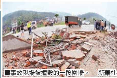
事故現場被撞毀的一段圍牆。

記者從新寧縣委宣傳部獲悉，據初步調查，車上載有52名乘客，事故原因為雨天路滑，司機不熟悉路況，急急開車導致車輛撞上護欄側翻。