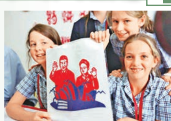
澳洲學校學生展示習大大和彭媽媽剪紙作品。謝驥馳 攝生在信裡寫下心願：希望習主席和彭媽媽到塔斯馬尼亞州訪問。令師生們驚喜的是，他們不但收到習大大和彭媽媽親筆簽名的照片和回信，而且還收到訪問中國的邀請。記者 達明 天津報道

一年前，澳洲塔斯馬尼亞州斯科奇·歐克伯恩學校師生，聽說中國領導人習近平主席和夫人將要訪問澳洲，於是，由該校一位12歲的男孩Zach發起，16名小學