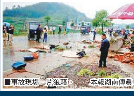
事故現場一片狼藉。