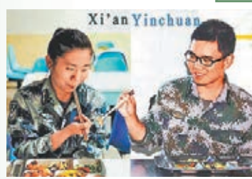
軍人情侶的穿越照感動網友。

他在寧夏銀川，她在陝西西安，兩名身處部隊中的情侶相隔遙遠；為了排解思念之情，兩人將彼此生活中的小片段，用一張張照片拼接在一起，看上去就和同處於一個空間似的，「溫馨卻讓人飄淚」，演繹着自己一段雙城之戀。在微博上，日前一組這對軍人情侶的異地穿越照，感動了無數網友。