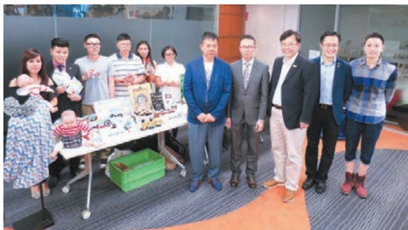
■貿發局於5月29日及30日連續第七年主辦「創業日」，集合逾270家各行各業參展機構，冀透過展覽、研討會及論壇等活動，為有意創業人士提供資訊。

「創業日」並會舉辦逾25場創業研討會，邀請逾50名不同行業的創業達人暢談創業心得，同時會加強「Fund & Mentor 創業項目配對」計劃，預計安排約60場配對，參與機構包括理工大學企業發展院、數碼港、浩觀及青