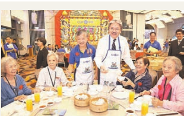
■財政司司長出席「老友記嘆早茶」啟動禮。