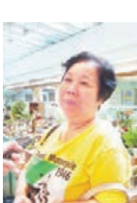
一早到場 ■沙田居民李太太於早上6時半已到達一田門外排隊。