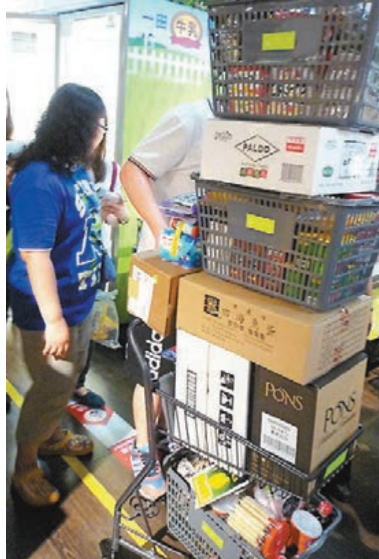
■賴太與兒子在超市部購入總值約3,000多元的食品，貨品堆疊高度如成年人。