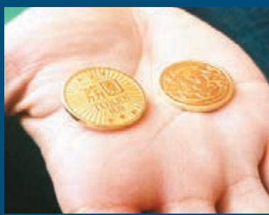
▲參與遊戲需購買代幣，一個代幣需要10元。

紹其中10個，包括「吸蕉大笨象」：昔日荔園的標記大笨象天奴將會以機械設計與大家見面，遊人可以給它餵食香蕉，它亦會做出噴水、發聲，甚至排便的動作。由於是次短期性重開，及要經過漁護署批准，故不考慮引入真正動物。