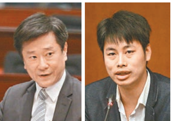
陳勇認為特首普選可讓香港民主跨出一大步。資料圖片