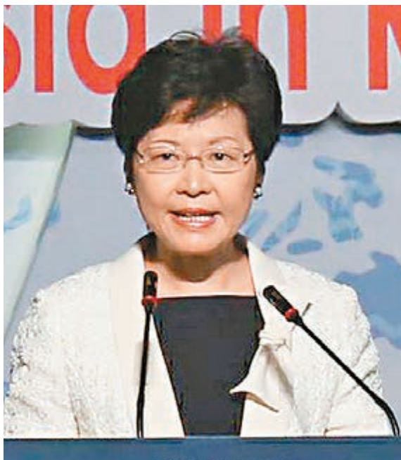
林鄭月娥昨於博鰲亞洲青年論壇開幕式上致辭。

香港文匯報訊（記者 鄭治祖）成功落實2017年特首普選，將會是香港民主發展的里程碑，署理行政長官林鄭月娥昨日在博鰲亞洲青年論壇上強調，特區政府公布的2017年特首普選方案是全面、合憲、合法、合情、合理和可行的，能讓香港民主發展走出歷史性的一步。她呼籲香港各界，尤其是年輕人，齊心支持落實2017年特首普選，為香港民主發展作出貢獻。