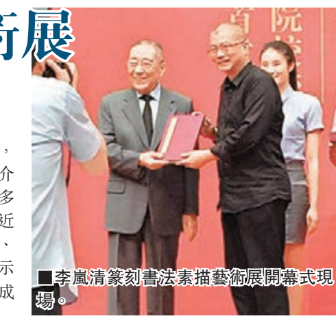
■李嵐清篆刻書法素描藝術展開幕式現場。

創作了大量的篆刻、書法和繪畫作品，並在國內和國外多次舉辦展覽。據介紹，本次展覽展出李嵐清創作的400多方篆刻原件、70餘幅書法作品，以及近200幅素描繪畫作品等，以詩、書、畫、印、圖片、文字結合的形式，展示李嵐清在篆刻、書法和素描創作上的成果。