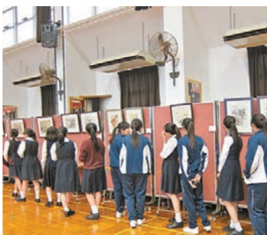
■賽馬會毅智書院學生在認真欣賞冊頁。

香港12間中學的學生，將有機會於2014至2015學年度，在校內近距離欣賞到由八間中國博物館授權仿製的名家書畫作品。活動中所展示的仿真畫，有明代至近代的立軸、冊頁及手卷。展品原作來自瀋陽故宮博物院、遼寧省博物館、南京博物院、廣東省博物館、四川博物院、雲南省博物館、重慶中國三峽博物館、東莞市博物館。且其中不乏名家作品，包括明代唐寅、董其昌；清代朱耷、原濟；近代張大千、齊白石、徐悲鴻等大家的墨寶。