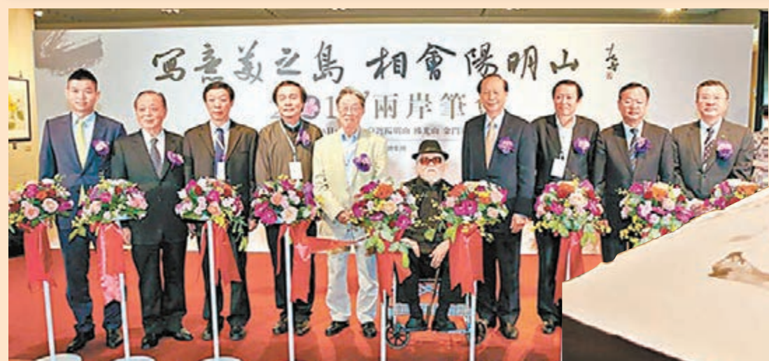
■2015兩岸筆會日前於台北拉開序幕。

近年來，兩岸間的交流不再是旅遊觀光時的淺嘗即止，文化層面的互動愈加頻繁及多元，更有不少台灣藝術家開始進駐內地藝術館，其作品深受內地同胞的喜愛。這種喜愛之情不但建立在藝術渲染力之上，其中亦有文化親暱的功勞在。無疑，中華文化在兩岸聯繫中扮演著「共同交集」的重要角色。因此，筆會期間大師們除攜手採風、聯袂創作、交流切磋之餘，聊得最多的還是如何加深加強文化藝術領域的溝通與了解。但在參加各種座談會、見面會、茶話會之前，70餘位藝術家紛紛提出想去金門走一遭。