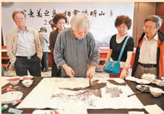
■94歲的大陸著名國畫大師劉伯駿(中)現場作畫，著名作家王蒙(左一)、魏明倫(右一)在一旁觀摩。

台灣著名詩人鄭愁予2006年於金門創作了名為《橋》的現代詩：「橋，架下的岸邊沒有對立，不存在水土的消長；橋，是結構的緣、是金石的婚姻，讓