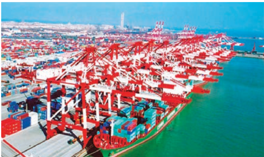
廣東相關「走出去」項目已在匯集中。