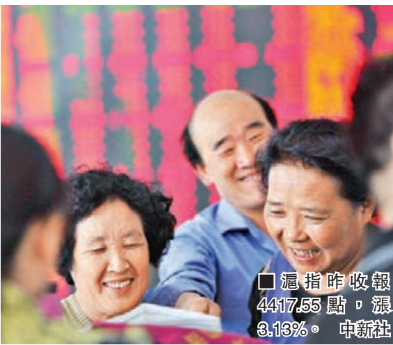
滬指昨收報4417.55點,漲3.13%。

香港文匯報訊(記者 裴毅 上海報道)滬深兩市昨權重股一改近日疲軟走勢,以金融板塊為首輪番拉升,推動主板股指雙雙大漲超3%,並提振創業板指數回升再創新高。收盤上證綜指報4,417點,漲幅3.13%,成交6,938億元(人民幣,下同);深成指報15,127點,漲幅3.1%,成交7,302億元;創業板報3,322點,漲幅1.35%。