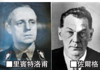
里賓特洛甫 佐爾格 蘇聯著名間諜，化名「拉姆齊」的佐爾格在1930年代以記者及德國使館新聞專員身份進入日本，監視納粹德國及日本

本動向，對蘇聯抗納粹德國入侵功不可沒。東京一間古書店最近發現時任納粹德國外長里賓特洛甫在1938年寫給佐爾格的信函，祝賀他43歲生日，又高度讚揚佐爾格為德國所作的貢獻，反映佐爾格深得納粹當局信任。