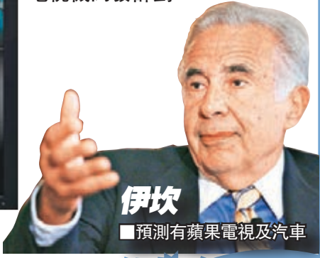
伊坎 ■ 預測有蘋果電視及汽車

知情人士稱，蘋果一直研究應用於電視機的突破性功能，除了超高清顯示器外，還考慮配備具備感應功能的攝錄鏡頭，讓用戶能透過電視進行視頻通話，但庫克認為單靠這些技術，不足以在韓國三星為首的電視機市場分一杯羹。