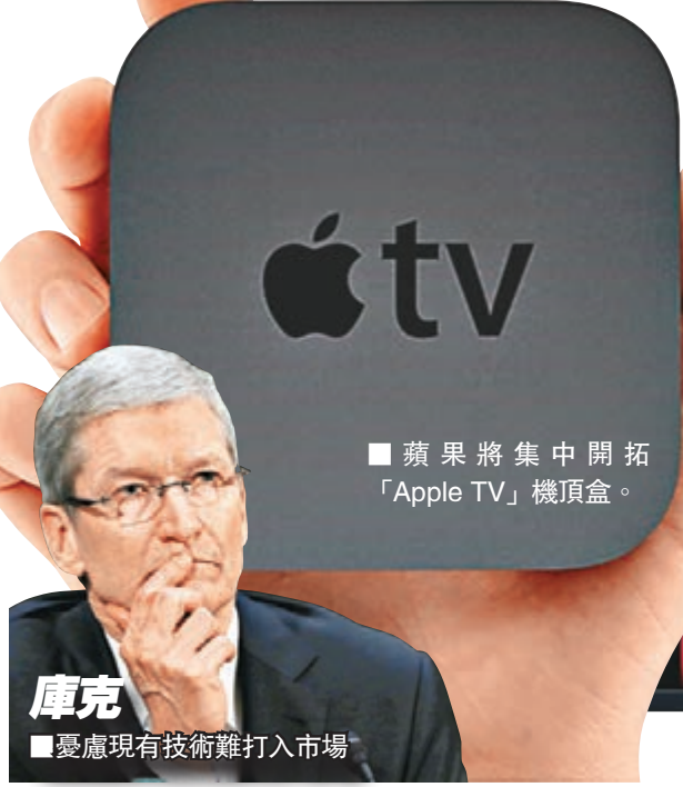
■ 蘋果將集中開拓「Apple TV」機頂盒。

科技巨擘蘋果公司早在「教主」喬布斯年代，已銳意開發自家品牌電視機，現任行政總裁庫克前年更聲稱，蘋果對有關項目有「巨大願景」。但據《華爾街日報》引述知情人士透露，蘋果由於未能開發出用於電視上的嶄新技術，憂慮無法打入這競爭激烈的市場，因此早於一年多前已悄悄擱置電視機開發計劃。