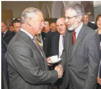
查爾斯（左）與亞當斯（右）握手寒暄。

英國王儲查爾斯昨日展開在愛爾蘭的4天訪問行程，與愛爾蘭共和軍政治組織新芬黨領袖亞當斯歷史性會面，以推動英國及愛爾蘭和解。