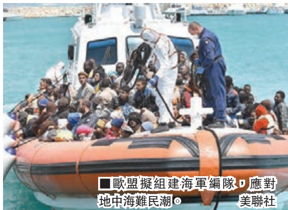
歐盟擬組建海軍編隊，應對地中海難民潮。

歐盟成員國昨日開會後同意破天荒組建海軍編隊，堵截地中海偷渡船，必要時甚至摧毀船隻，英國、法國、意大利等國已承諾提供有關軍備。歐盟外交事務專員莫蓋里尼表示，有關行動最快下月起全面執行，希望趕及在夏天偷渡潮高峰前實施。