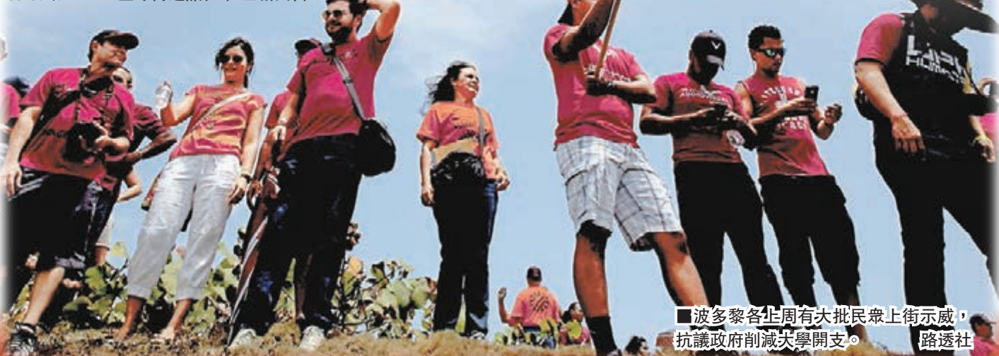
波多黎各上週有大批民眾上街示威，抗議政府削減大學開支。

美國財務部上月曾告知波多黎各方面，聯邦政府無意出錢救助，只會提供技術性指導，確保波多黎各善用目前擁有的所有選項。波多黎各政府則期望美國國會通過法案，允許一些公共機構申請破產保護，紓緩政府債務重擔。波多黎各又計劃舉辦多場「投資者峰會」，向拉丁美洲、西班牙及美國拉美裔社群招手，希望吸引外資流入。 ■彭博通訊社/霍士新聞台