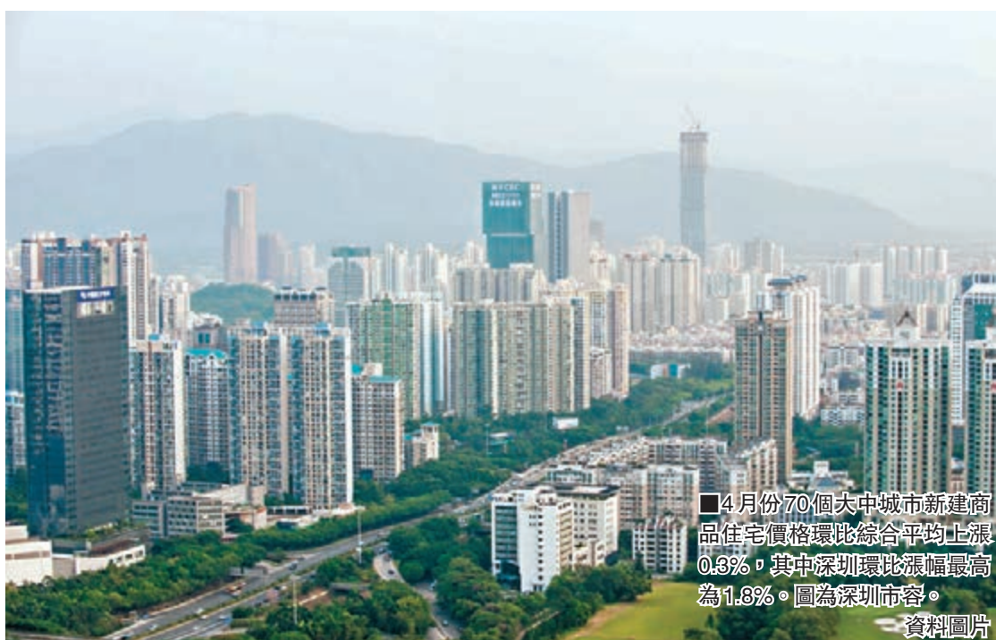
4月份70個大中城市新建商品住宅價格環比綜合平均上漲0.3%, 其中深圳環比漲幅最高為1.8%。圖為深圳市容。

杭州等城市出現標誌性止跌, 溫州環比上漲0.7%, 杭州環比上漲0.4%。這兩個城市是上一輪降價的重災區, 3月份房價還分別環比下降0.2%、0.5%。