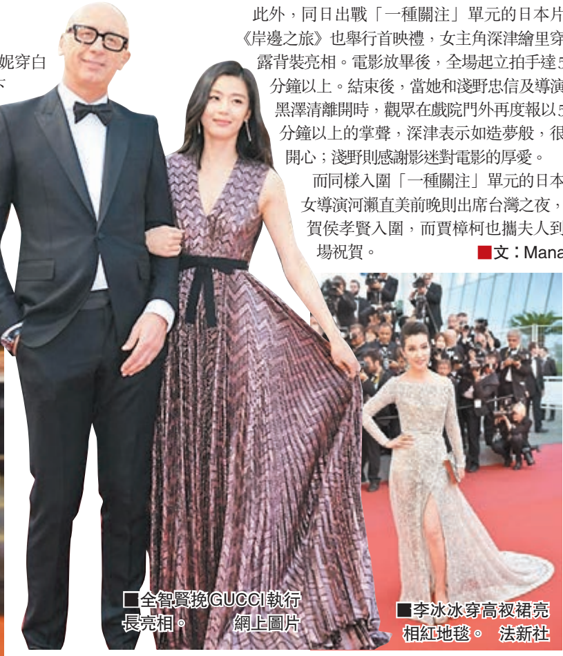
全智賢挽 GUCCI 執行長亮相。網上圖片