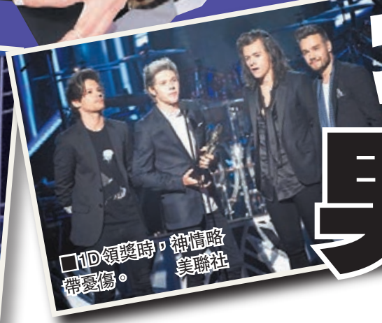
1D 領獎時，神情略帶憂鬱。