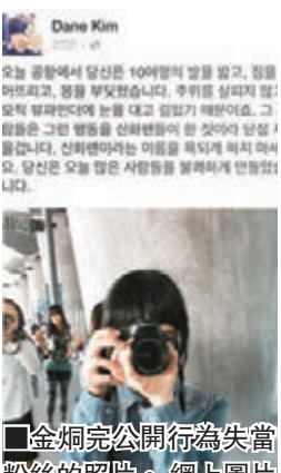
金炯完公開行為失當粉絲的照片。