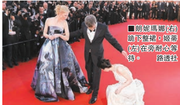
朗妮瑪娜(右)跪下整裙，姬蒂(左)在旁耐心等待。

第 68 屆康城影展於 17 日踏入第 5 天，最矚目必是由姬蒂白蘭芝 (Cate Blanchett) 夥朗妮瑪娜 (Rooney Mara) 主演的競賽片《Carol》，李冰冰和全智賢現身紅地毯揚揚，而全智賢更獲 GUCCI 執行長陪同，一齊亮相，盡顯超凡地位。而在片中飾演雙性戀的姬蒂早前透露曾戀女生，但前日在記者會上卻斥責報道失實。