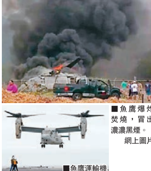
■魚鷹爆炸焚燒，冒出濃濃黑煙。網上圖片

墜毀魚鷹屬於海軍陸戰隊專用的MV-22型，24架同型機目前已部署在沖繩普天間，美軍亦計劃於2017年底，在橫田基地部署空軍型號的CV-22型。不過魚鷹自研發以來一直問題多多，2000年測試期間曾兩度墜毀，造成23名陸戰隊隊員死亡，令開發計劃險些被中止。時事通訊社/法新社/美聯社