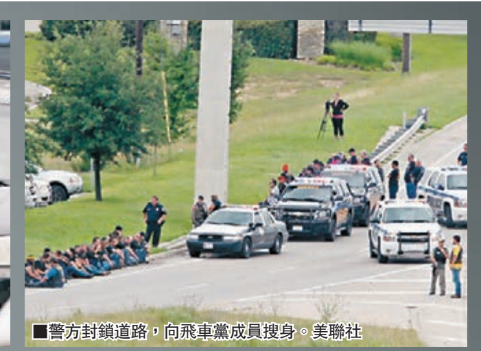
■警方封鎖道路，向飛車黨成員搜身。