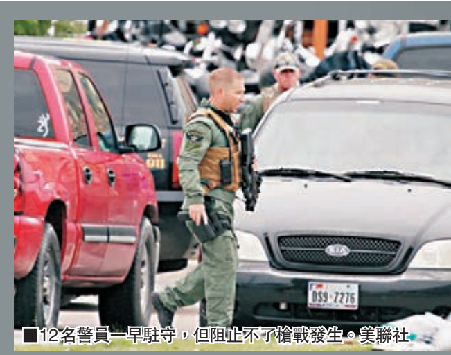
■12名警員一早駐守，但阻止不了槍戰發生。