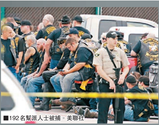
■192名幫派人士被捕。

美國得州中部韋科市前日爆發嚴重黑幫火拚，最少5個飛車黨幫派在午飯時分，相約於一間餐廳談判，各人先是口角推撞，繼而演變成槍戰械鬥，有目擊者稱現場傳出多達100下槍聲，場面恍如戰區。事件共造成9人死亡、18人受傷。警方事後封鎖現場，並拘捕192人。