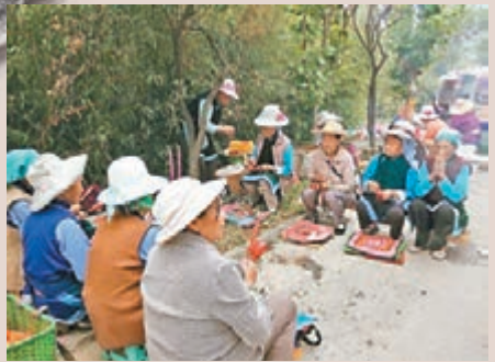
「花子會」上，人們在誦經祭拜。

一年一度的「花子會」日前在大理古城北門東嶽廟旁舉行。附近的白族群眾在此搭鍋起灶，燒煮祭祀用的祭品。待祭品準備好後，就到東嶽廟裡祭拜，