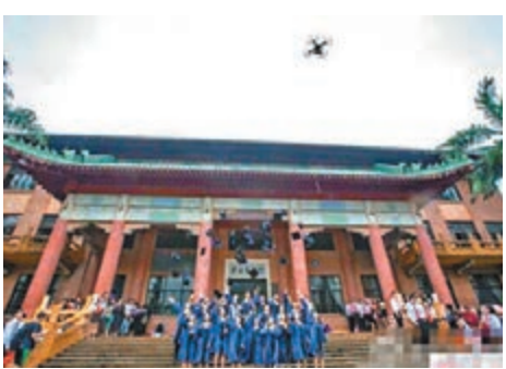
華農大學食品學院畢業生們分批享受無人機帶來的航拍趣味。

據悉，操作無人機的是已從華農畢業的一位校友，在畢業季裡他主動聯繫學校，表示希望帶着無人機回校，為師弟姐妹們