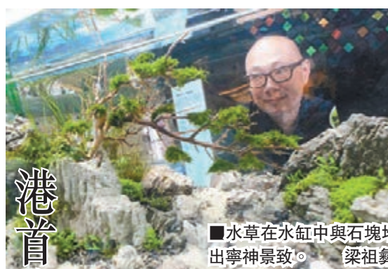
水草在水缸中與石塊堆砌出寧神景致。

腦維修、鐘錶維修，並由政府帶頭，以半價租出工廈予殘疾人士發展小生意「自給自足」。 他又說，不少殘疾人士擁有的牌照，希望政府批出部分的士專屬殘疾人士駕駛，讓殘疾人士自備的士司機。