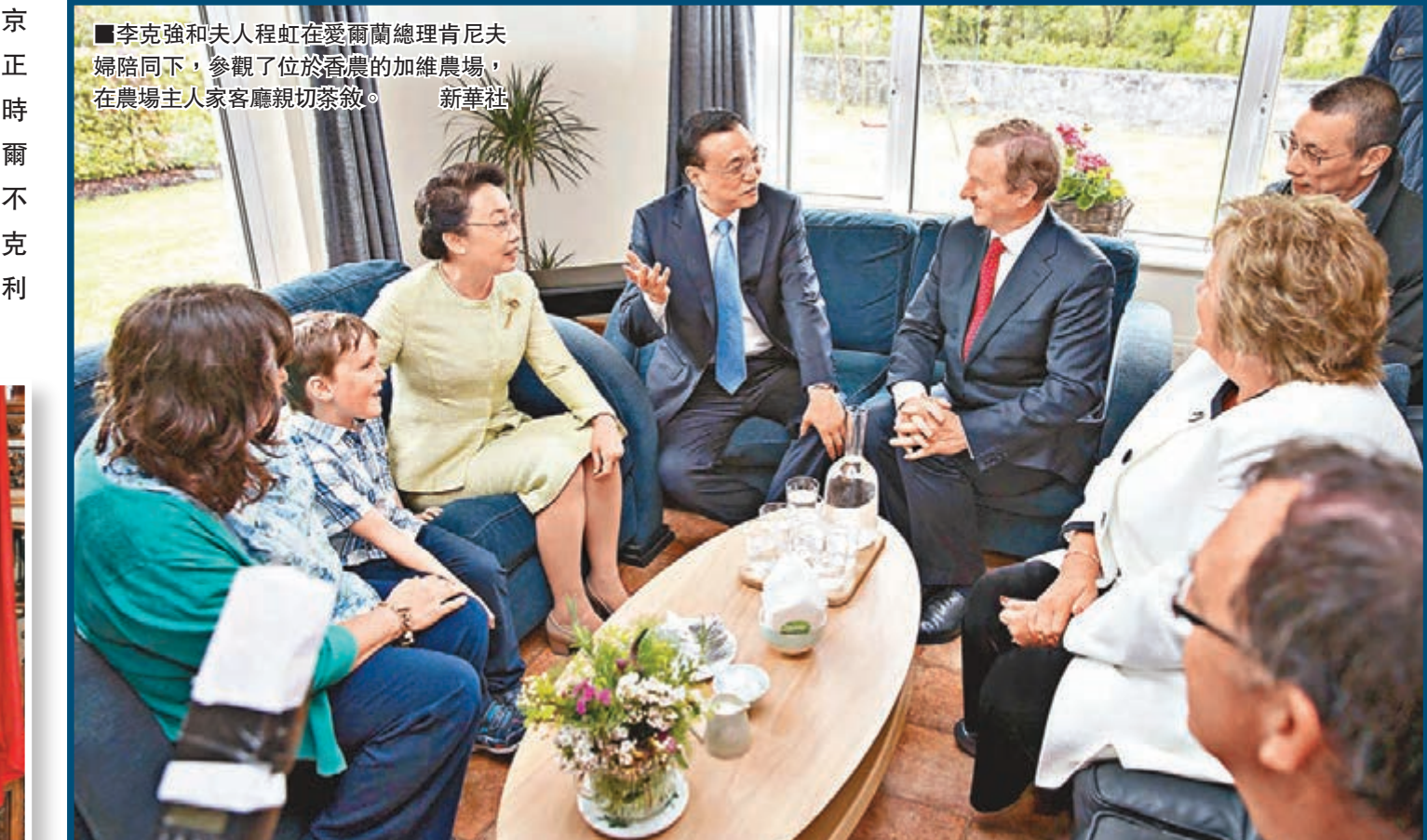
李克強和夫人程虹在愛爾蘭總理肯尼夫婦陪同下，參觀了位於香農的加維農場，在農場主人家客廳親切茶敘。新華社

會，雙方將開展互訪拜會、專業研討、文化交流等活動。國際海道測量組織(IHO)為政府間組織，其成員為沿海國家政府。該組織主要任務是通過各國海道測量機構的努力合作，確保為海上航行和其他用途提供準確和實時的全世界範圍內的海道測量信息，以及利用海道測量數據來支持海洋其他相關學科的發展，並加快它在地理信息系統中的應用。