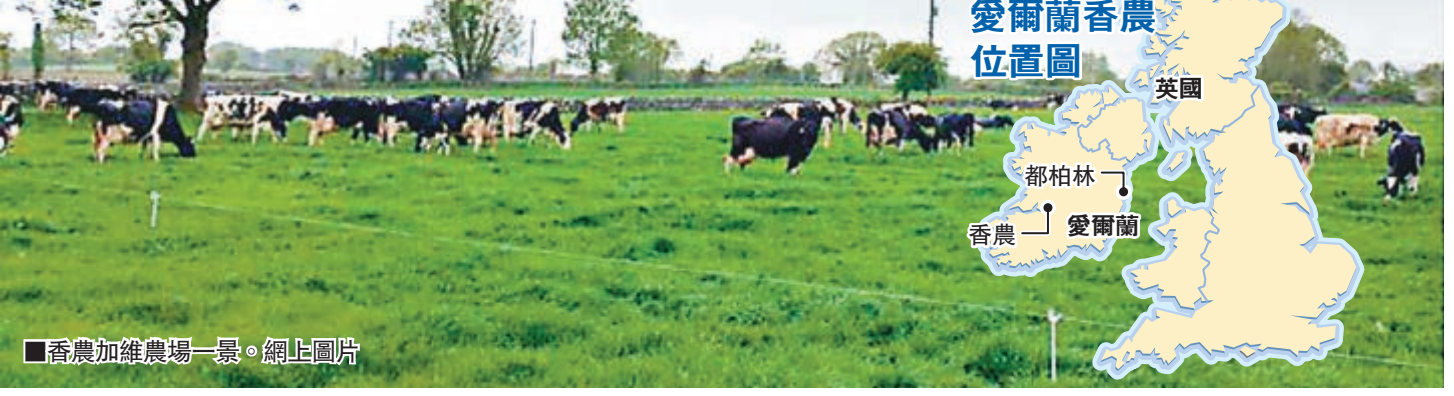
香農加維農場一景。網上圖片