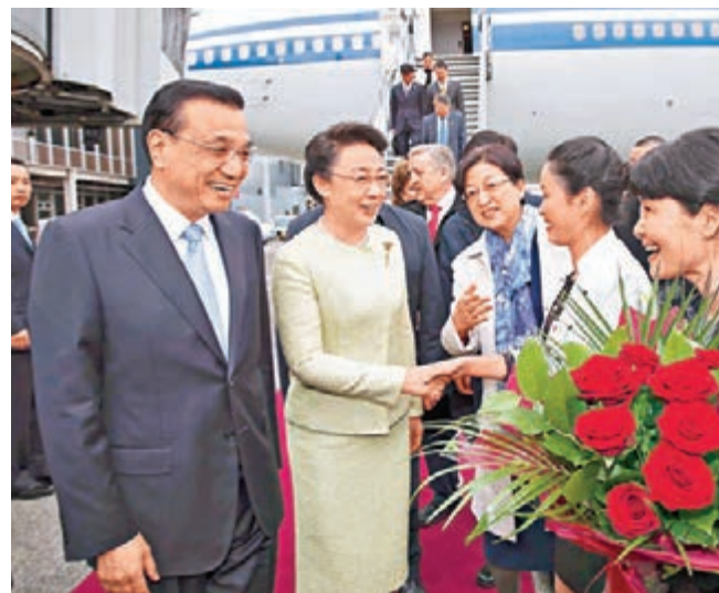
李克強和夫人程虹乘專機抵達愛爾蘭香農機場。新華社