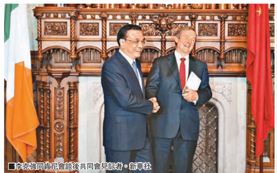
李克強同肯尼會談後共同會見記者。新華社

香港文匯報訊 綜合新華社及《新京報》報道：李克強在赴拉美四國進行正式訪問途中，當地時間17日下午14時許，在愛爾蘭香農技術經停，並對愛爾蘭進行過境訪問。雖然從抵達到離開不足24小時，但愛方對這次中國總理過境訪問給予了高規格接待。李克強參觀了家庭農場，更與愛爾蘭總理肯尼舉行雙邊會談，見證雙方便利人員往來、農業等領域合作文件的簽署，並共同會見記者。