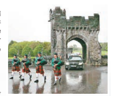
穿蘇格蘭裙的樂手以傳統音樂歡迎李克強夫婦。

肯尼夫婦還為李克強夫婦舉行家庭晚宴。席間，李克強總理向肯尼贈送了禮物，包括「來自家鄉安徽」的黃山毛峰茶葉，肯尼則向總理贈送了愛爾蘭著名詩人葉芝的詩集等。