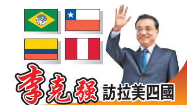
李克強訪拉美四國

香港文匯報訊 綜合新華社及《新京報》報道：李克強在赴拉美四國進行正式訪問途中，當地時間17日下午14時許，在愛爾蘭香農技術經停，並對愛爾蘭進行過境訪問。雖然從抵達到離開不足24小時，但愛方對這次中國總理過境訪問給予了高規格接待。李克強參觀了家庭農場，更與愛爾蘭總理肯尼舉行雙邊會談，見證雙方便利人員往來、農業等領域合作文件的簽署，並共同會見記者。