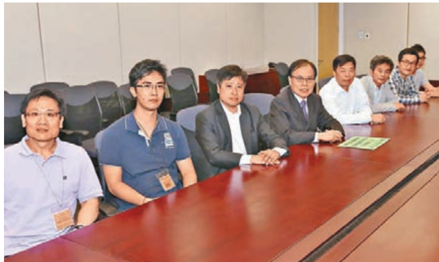
香港島各界聯合會代表昨於座談前合影。