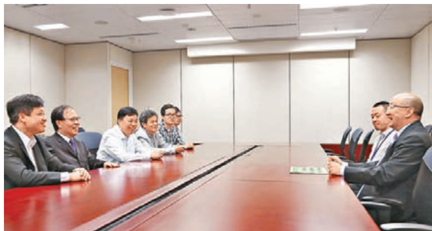
香港島各界聯合會代表昨與譚志源局長討論政改方案。