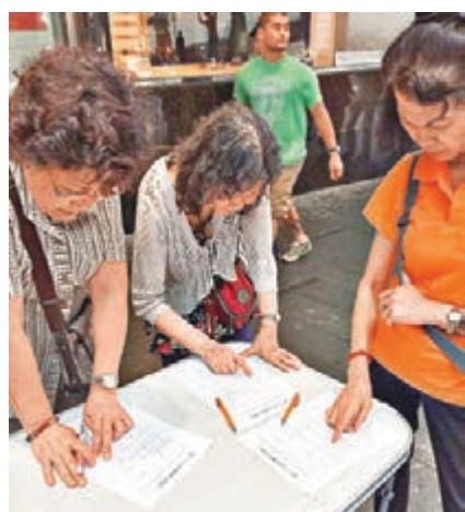
香港島各界聯合會日前於街上向市民做問卷調查。

蔡：對通過政改仍是審慎樂觀的。這除了「4·22」方案確是一個對香港未來發展和福祉（包括政治、經濟、民生等）最有利的方案，體現了香港的主流民意，更是中央政府一直展示出真心給予香港民主發展的決心和誠意，特區政府和所有官員總動員落區宣傳，讓市民更清晰「4·22」方案的內容和好處，更廣泛的樹立對香港特區行政長官普選的制度自信；此外，國際輿論對「4·22」方案也持正面態度，溫和反對派和反對派中的有識之士，也表達要「對得起香港」的正面信息，使到政改方案的通過存在曙光。