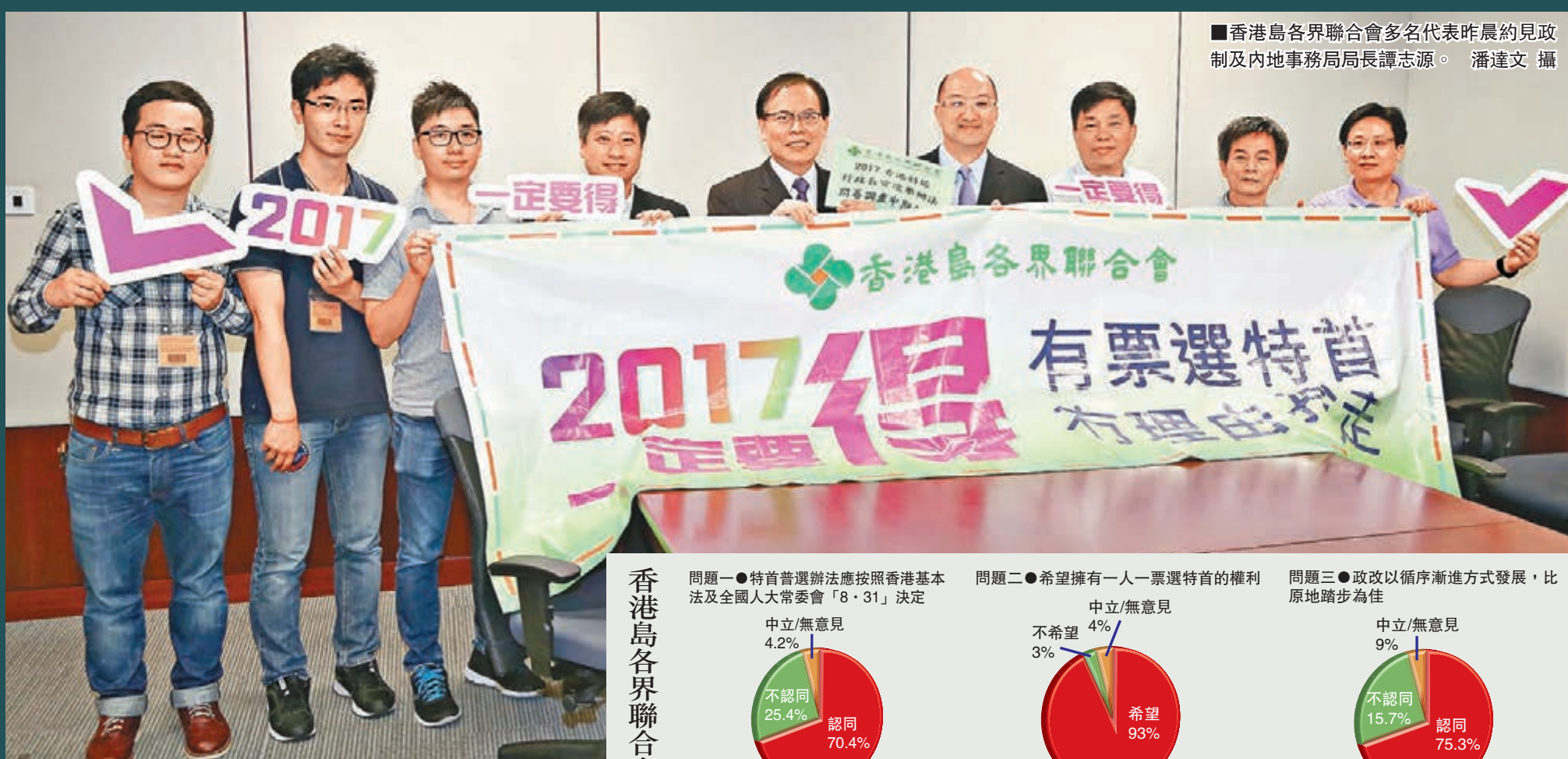
香港島各界聯合會多名代表昨晨約見政制及內地事務局局長譚志源。

香港文匯報訊（記者 鄭治祖）隨着立法會表決2017年特首普選方案的日子愈來愈近，香港社會支持2017行政長官普選方案的民意聲音愈見清晰。港島各界聯合會昨晨約見政制及內地事務局局長譚志源，遞交2017香港特區行政長官選舉辦法問卷調查中期報告，港區全國人大代表、香港島各界聯合會理事長蔡毅表示，民調結果發現，多達70.1%受訪者認同政改方案，反映市民比較理性務實，願意接受政制一步步向前發展。譚志源則表示，未來數星期是政改工作的關鍵時刻，特區將會繼續努力落區宣傳政改，期望最終政改方案可獲通過。