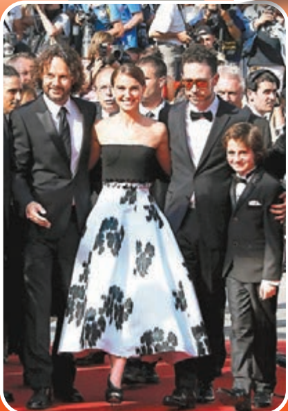
妮姬莉寶雯(中)現身其執導的新片《A Tale of Love and Darkness》首映。