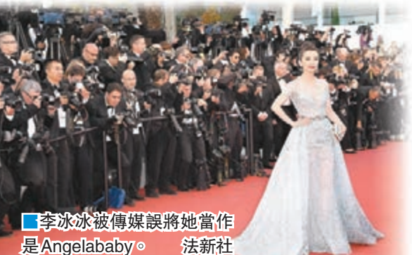
李冰冰被傳媒誤將她當作是 Angelababy。