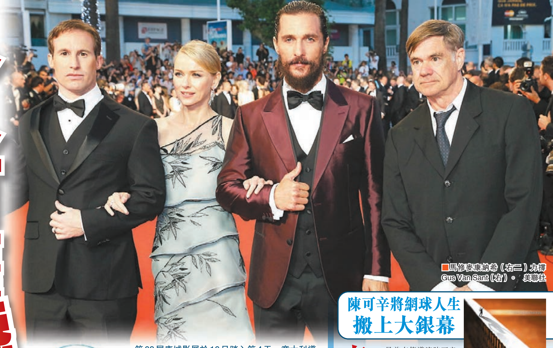
馬修麥康納希(右三)勁撐 Gus Van Sant(右)