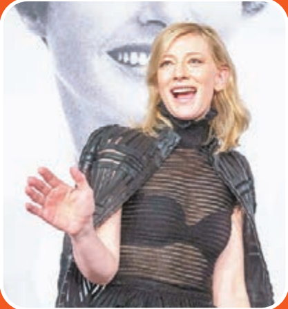
妮姬莉寶雯透 Bra 示人。