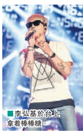
李弘基於台上拿着棒棒糖。

壓軸出場的 CNBLUE 帶來《Coffee Shop》、《Diamond Girl》等8首大熱作，隊長鄭容和不時改歌詞，唱好香港；姜敏赫用廣東話問：「大家吃咗飯未?我好掛住你嘍。」李宗泫表示：「今(前)日我哋玩得開心嘍。」李正信謂：「好開心見到大家，掛唔掛住我哋，我都好掛住你嘍。」其間，鄭容和突然下台走到歌迷旁，唱到《Can't Stop》時，又一度彈錯，以笑遮醜。安哥時，5組單位齊現身舞台大合唱，鄭容和跟 AOA 及 N.Flying 學跳舞，李弘基在小舞台熱唱時，卻不小心被煙燻面，最後，他們與全場歌迷大合照後才離去。