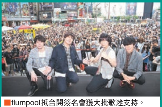
flumpool 抵台開簽名會獲大批歌迷支持。

日本超人氣樂團 flumpool 將在7月4日於 TICC 台北國際會議中心舉行「flumpool Taiwan Special Live 2015」。他們昨日現身西門町廣場舉行簽名會，吸引大批粉絲撐場。主唱山村隆太全程大晒中文說：「五月天的怪獸告訴我們，台灣簽名會的女生都很可愛。」據悉，有歌迷凌晨便來排隊等待，更有日本歌迷特地飛來台灣參加簽名會。flumpool 堅持不限名額，來多少人就簽多少，唱片公司特地送上超巨型的「首簽神氣筆」紀念。