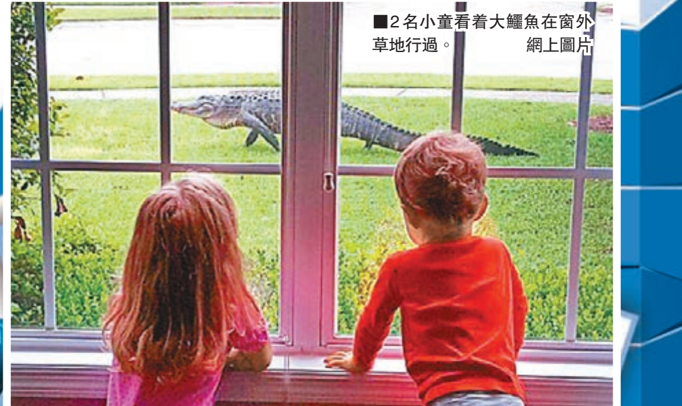
2名小童看着大鱷魚在窗外草地行過。