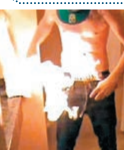
挑戰者將易燃液體倒在身上，然後點火。

社交網站facebook(fb)及影片分享網站YouTube近日興起一種「點火挑戰」，挑戰者會將易燃液體倒在身上，然後點火，趁火尚未燒遍全身時跳入浴缸或水池。據報去年曾有美國少年因此喪命，有家長向fb投訴，fb及YouTube聲稱正在移除這類短片，但在YouTube仍然可以看到同類片段。