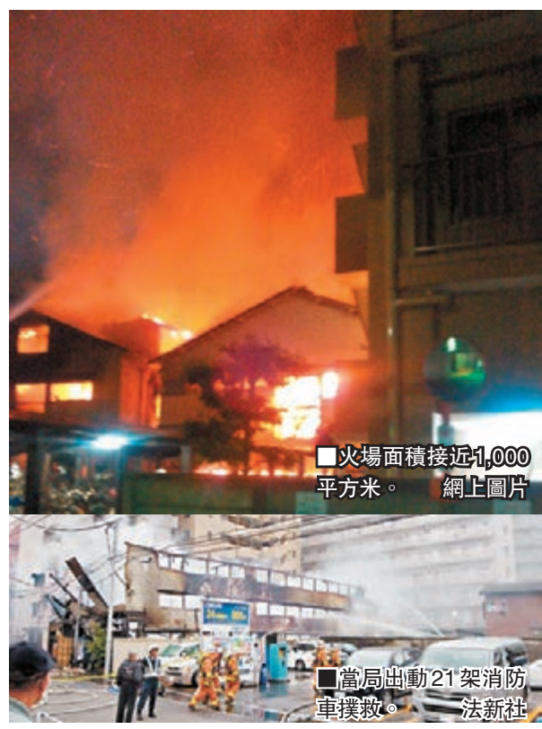
火場面積接近1,000平方米。

天亮後可見民宿損毀嚴重，現場仍瀰漫燒焦味，消防員持續射水降溫以防死灰復燃。當局事後在火場發現4具屍體，其中1人是約50歲的男性。附近居民透露，入住該兩間民宿的大多是散工工人、領退休金過活的長者或領取低收入救濟金的窮人，部分更是長住。