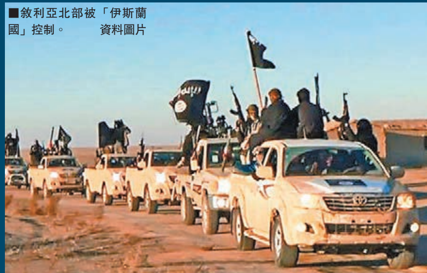
敘利亞北部被「伊斯蘭國」控制。資料圖片

緬甸拒絕承認羅興亞族穆斯林為公民，去年11月更頒布新政策，要求他們出示1948年獨立至今的居住證明，以獲取歸化公民資格，否則便要送到集中營準備遣返。然而人權組織表示，很多羅興亞人根本沒相關書面證明，亦未能達到逾60年的居住條件。當局今年2月廢除羅興亞人投票權，加劇難民潮。