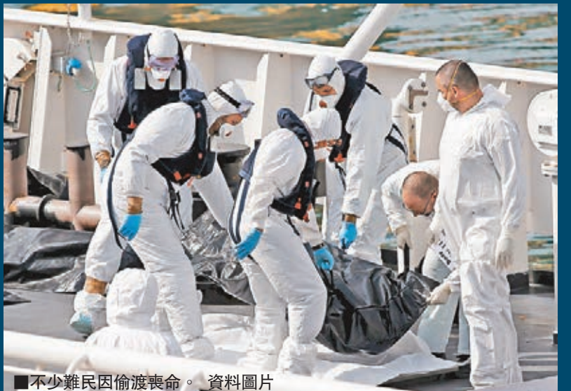
不少難民因偷渡喪命。資料圖片