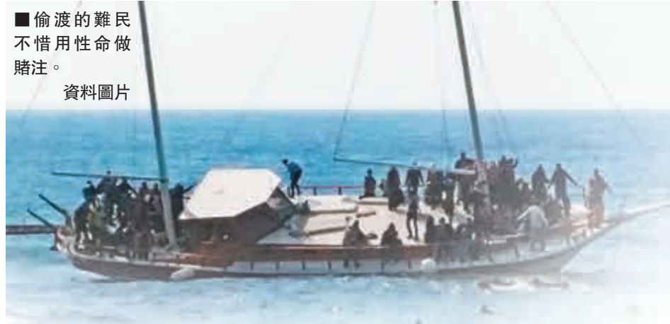
偷渡的難民不惜用性命做賭注。

國際難民危機不斷，上月一艘載着900人的難民船在地中海沉沒，近日有緬甸難民船遭泰國、馬來西亞及印尼先後拒收。國際貨幣基金組織(IMF)前首席經濟師、哈佛大學經濟及公共政策教授羅戈夫批評發達國家偽善，只顧考慮本國利益，卻沒想過解決全球經濟不平等，令難民問題始終無法解決。