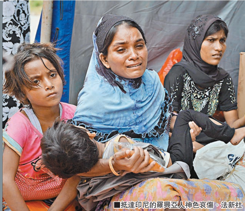
抵達印尼的羅興亞人神色哀傷。