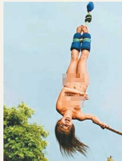
少女跳下前突然脫衫裸玩「笨豬跳」，過程由同行友人攝下。網上圖片

香港文匯報訊(記者 杜法祖)一名自稱是模特兒的港女，月初在泰國北部清邁以全裸方式大玩俗稱「笨豬跳」的高空彈跳遊戲，相關影片在互聯網上瘋傳後，驚動當地警方介入調查，據當地傳媒報道，警方事後以猥褻罪拘捕場地負責人，並處以1000泰銖(約港幣230元)罰款。當地官員表示會追查該名自稱是「港女」的少女是否仍留在泰國，不排除追究有關責任。