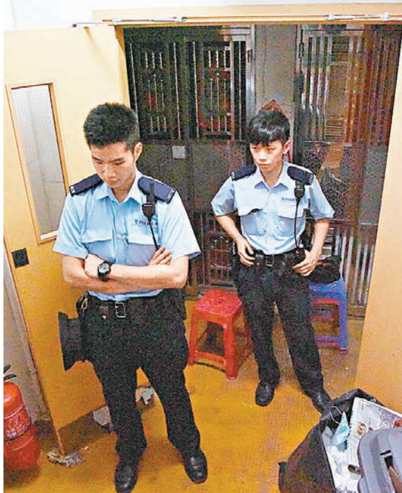
警員昨日仍封鎖元朗兇案劊房單位調查。

昨午2時許，10多名元朗重案組探員重返現場調查，並向附近店舖索取閉路電視片段了解，並設法聯絡該名可疑男子助查。警方呼籲任何人士如認識死者或可提供與該案有關資料，可致電3661 4644或3661 4645與元朗警區重案組或聯絡任何一間警署。