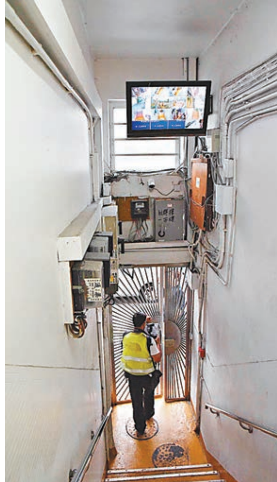
案發大廈也設有閉路電視，拍攝到案發前有可疑男子進出的清晰影像。