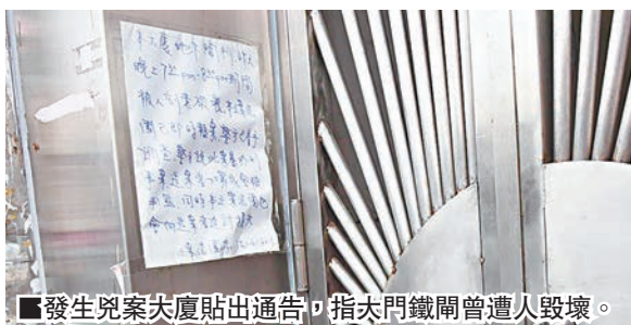
發生兇案大廈貼出通告，指大門鐵閘曾遭人毀壞。