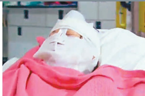
遭淋潑通渠水嚴重灼傷女經理送院救治。

英國特許房屋經理學會、香港物業管理公司協會、房屋經理學會、地產行政師學會、房屋經理註冊管理局等5個團體對襲擊物管人員的暴力行為表示極度遺憾，並強烈譴責有關暴力行為，對傷者致以最深切慰問，並祝