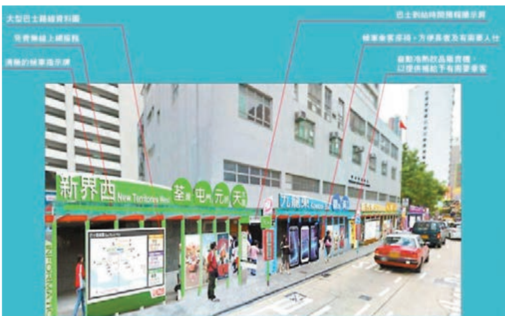
巴士站優化，提供更清晰路線及班次資訊，加裝巴士到站時間預報顯示屏、大型巴士路線資料圖、自動冷熱飲品販賣機、候車乘客座椅等。

另外，因應港鐵西港島線已全面通車，新巴城巴將於明日實施第二階段第二輪巴士路線重組，並取消新巴43X號線、46X號線、城巴3B號線及70M號線，城巴70號線則將延長行車路線至華貴邨，並新增70號線與789號線，以及12號線與12M號線的八達通轉乘優惠，亦會在平日早上繁忙時間增加特別班次巴士服務。