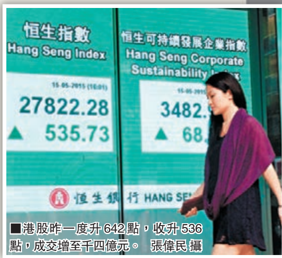
港股昨一度升642點，收升536點，成交增至千四億元。

深港通傳出台，港交所又成為大市焦點，股價急升5%至289.6元。除港交所外，連帶本港券商股、AH差價股也急升。英皇證券(0717)升一成，華富(0952)升7.8%，海通國際(0665)升6.3%，耀才(1428)升5.7%。浙江世寶(1057)升6.5%，東北電氣(0042)和山東墨龍(0568)升4%。中移動(0941)亦升3.6%報109元。平保(2318)、友邦(1299)更飆升近3%至4%。長和