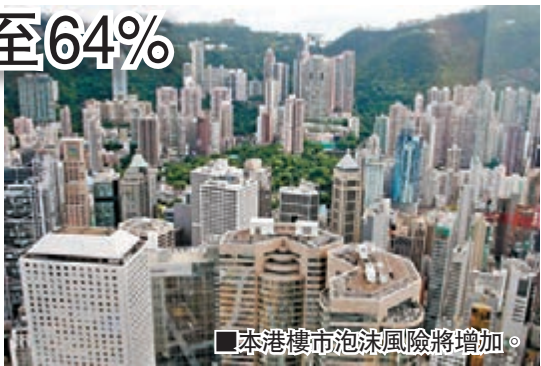
本港樓市泡沫風險將增加。

香港文匯報訊（記者 涂若奔）由於低息環境長期持續，樓市泡沫風險有增無減。《報告》指，本港住宅物業市場在今年首兩個月續見熾熱跡象，雖然第一季成交量較上一季微跌2%，但3月的整體樓價較1997年的高峰超出69%，市民的置業購買力指數在第一季進一步惡化至64%左右，遠高於1995-2014年期間的46%長期平均數。假如利率上調3個百分點至較正常的水平，該比率更將飆升至83%。