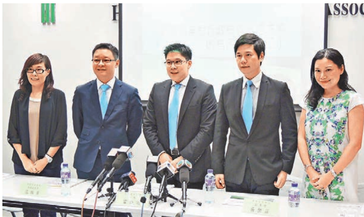
香港青年聯會強調，大多數香港青年認同特首普選方案，較現行的特首選舉辦法有進步，並對普選方案順利通過感到悲觀。

香港文匯報訊（記者 李自明）香港主流民意支持通過2017年特首普選方案，但近日「鍾氏民調」試圖混淆視聽，稱支持方案者正「逐漸減少」。香港青年聯會昨日公布的最新民意調查發現，62.9%受訪青年認為方案較現行選舉辦法進步，54.8%受訪青年認為立法會應該通過特首普選方案，78.8%更促請立法會議員在表決時要跟從多數民意。該會強調，目前距離政改表決時日無多，期盼反對派議員打開「溝通大門」，與中央及特區政府重啟對話，並依據民意投票支持特首普選方案。