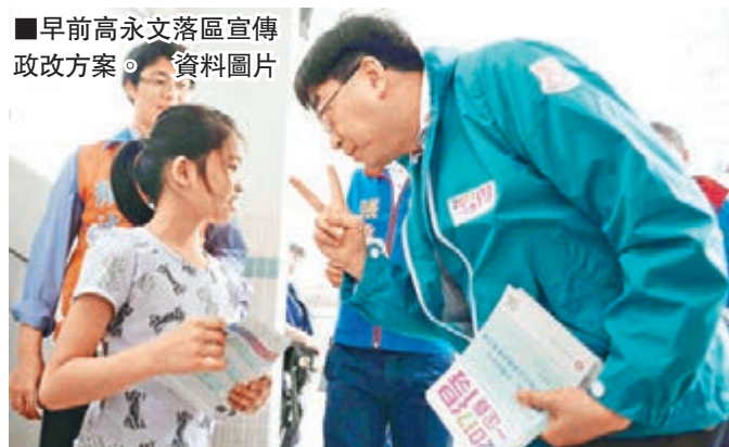
早前高永文落區宣傳政改方案。資料圖片

高永文昨日指出，落區宣傳的安排由政制及內地事務局負責。他身為問責團隊的一員，會繼續參與宣傳，及會在有需要時再落區，爭取與市民對話。他表示，不評論上次「激辯」是否對市民支持通過政改有影響。