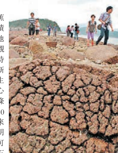
橋咀洲距離西貢市中心僅5分鐘船程