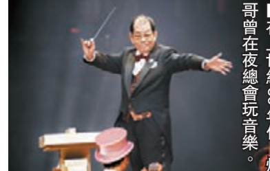
在上世紀60年代，輝哥曾在夜總會玩音樂。