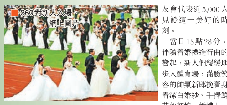
360對新人入場。

友會代表近5,000人見證這一美好的時刻。當日13點28分，伴隨著婚禮進行曲的響起，新人們緩緩地步入體育場，滿臉笑容的帥氣新郎挽着身着潔白婚紗、手捧鮮花的新娘。婚禮上，學生志願者們手捧「LOVE@ZJU」浙大對戒入場，新郎單膝跪地向新娘說出心中的誓約，雙方交換戒指，深情擁吻。「生日快樂」的音樂奏起，新人們為母校送上真摯而響亮的祝福——「浙大，生日快樂」。