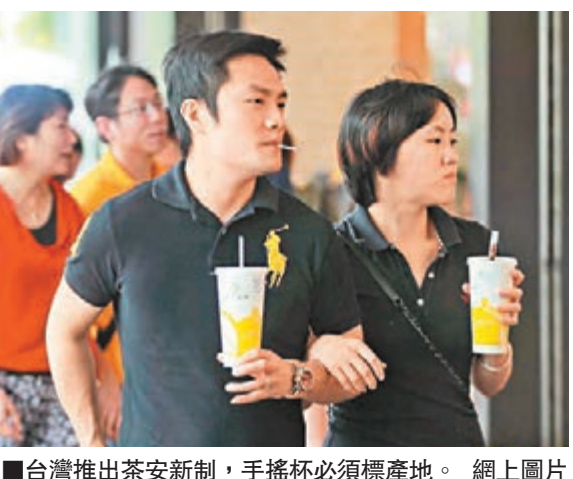
台灣推出茶安新制，手搖杯必須標產地。

香港文匯報訊 據中通社報道，面對手搖杯茶飲連環爆出農藥殘留問題，台灣「衛生福利部」「食品藥物管理署」（「食藥署」）昨日邀請119家連鎖茶飲、咖啡業者，召開「茶安管理新制預告」說明會議，宣佈從7月31日起，除了要強制檢驗與追蹤追溯外，菜單或是手搖杯都必須標明產地；咖啡產品則必須用紅黃綠標示咖啡因等級，而「果蔬」產品果汁含量未達一成以上者，只能用「果汁風味」來標示。