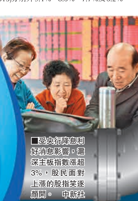
■受央行降息利好消息影響，滬深主板指數漲超3%，股民面對上漲的股指笑逐顏開。 中新社

高盛預計下次人行可能在第三季降準，但也不排除第二季底前可能發生。其他非貨幣放鬆政策可能包括加速財政支出，更多金融市場改革(例如深港通)，及可能闡明國企改革方案。