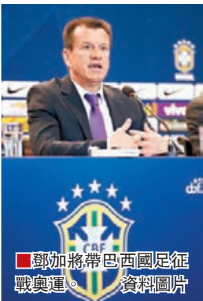
鄧加將帶巴西國足征戰奧運。資料圖片

亦因同時要帶多兩支隊伍，鄧加今、明兩年將會更忙碌，首先他要領軍參加下月的美洲盃，之後是年底帶領巴西出戰2018年俄羅斯世盃的南美洲預賽，到明年則是奧運，正宗「年終無休」。