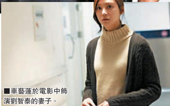
車藝蓮於電影中飾演劉智泰的妻子。