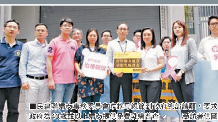
民建聯婦女事務委員會昨赴母親節到政府總部請願，要求政府為40歲或以上婦女提供免費乳癌檢查。

香港文匯報訊（記者 文森）民建聯婦女事務委員會昨赴母親節到政府總部請願，要求政府為40歲或以上婦女提供免費乳癌檢查，並呼籲所有女士自行接受檢查，及早預防乳癌。他們將請願信交給政府代表，要求食物及衛生局跟進該議題。