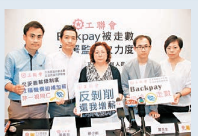
再有一名前社福機構員工批評機構扣她近10個月、合共約5,000元追補增薪。

由一名新手到現在，李小燕對這名兒科病房「男天使」的工作表現有90分，全因他的耐性、細心、溝通技巧及有判斷力。被問到對日後照顧小朋友是否已很有信心，阿輝笑說，「現時應該有信心，會懂得在他們哭的時候觀察及安慰一下他們，不會再感到煩厭。」