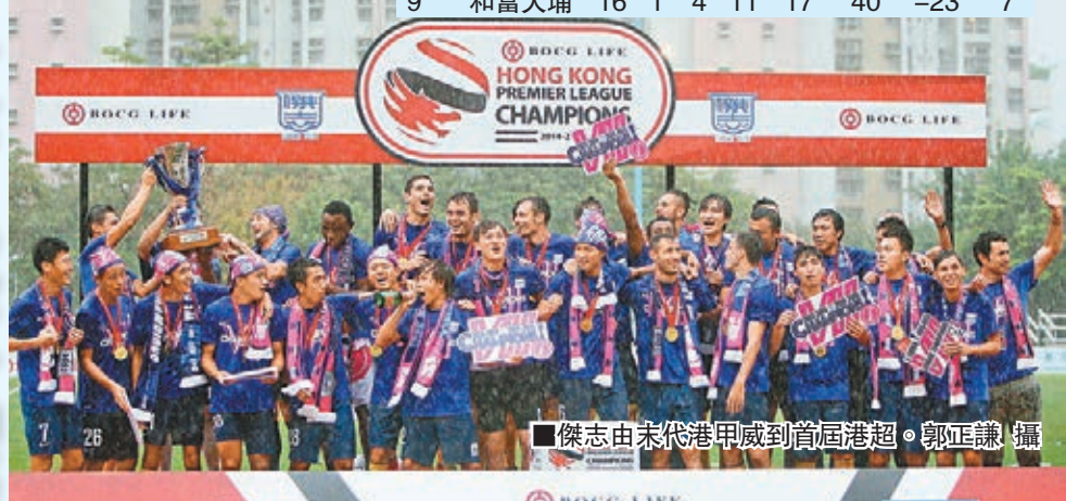
傑志由末代港甲威到首屆港超。

香港文匯報訊（記者 郭正謙）提早封王的傑志未能在港超收官戰畫上完美句號，昨日作客深水埗運動場以2:3敗於YFC澳滙腳下，雖然賽後的慶祝儀式未有受到影響，不過來季傳聞有主力球員離隊他投，加上主帥摩連拿亦宣布辭職，總領隊伍健承認球隊下季將有變動，但仍有絕對的把握衛冕港超。