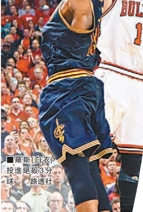
羅斯(白衣)投進絕殺3分球。