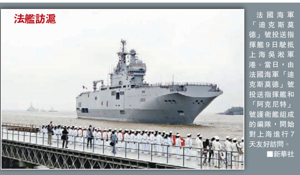
法國海軍「迪克斯莫德」號投送指揮艦9日駛抵上海吳淞軍港。當日,由法國海軍「迪克斯莫德」號投送指揮艦和「阿克尼特」號護衛艦組成的編隊,開始對上海進行7天友好訪問。