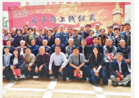
多名「紅二代」及離退休高幹出席正聲網上線儀式。

據介紹,正聲網將設立「正聲專欄」主題頻道,簽約具備財經、時政、文化、歷史、軍事、文學等專題方向的專家學者及願意主動發聲的紅色後代及離退休高幹幹部。