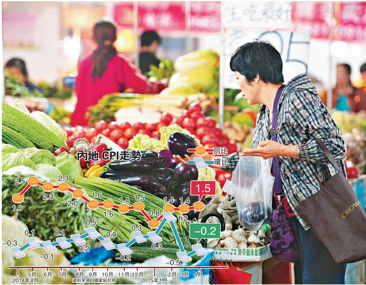
4月內地CPI同比上漲1.5%。圖為河北石家莊某街市內市民正在挑選蔬菜。

申銀萬國首席宏觀分析師李慧勇指出,國內豬肉為代表的食品價格上漲部分抵消了工業品價格下行的壓力,使得CPI漲幅回升;外圍美元貶值帶動的大宗商品價格反彈導致PPI跌幅收窄,顯示通縮苗頭有所緩解。