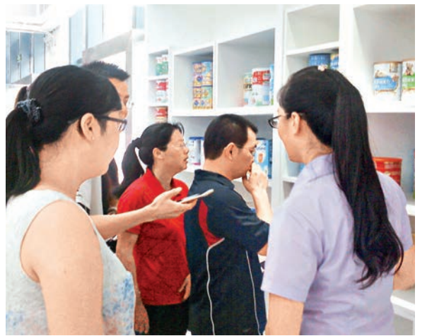
顧客正在店內了解商品。

香港文匯報訊(記者李昌鴻 深圳報道)騰邦集團福田保稅區保稅商品展示店昨日對外試營業,其面積高達3,000平方米,全天吸引約1,500名深圳年輕父母等到店參觀,並在微信商城「海搵網」上購買相關商品。騰邦前海跨境電子商務有限公司總經理倪軍透露,因福田店