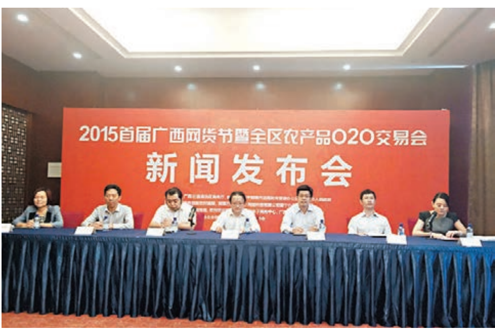
「2015首屆廣西網貨節暨全區農產品O2O交易會」新聞發布會現場。

香港文匯報訊(記者 曾萍 廣西報道) 「2015首屆廣西網貨節暨全區農產品O2O交易會」新聞發布會早前公布，廣西首屆網貨節將於5月22日至24日在廣西欽州舉辦。屆時，廣西14個地市的各名優特產、農副產品將結合400多個線下展位和線上平台推廣、展銷。