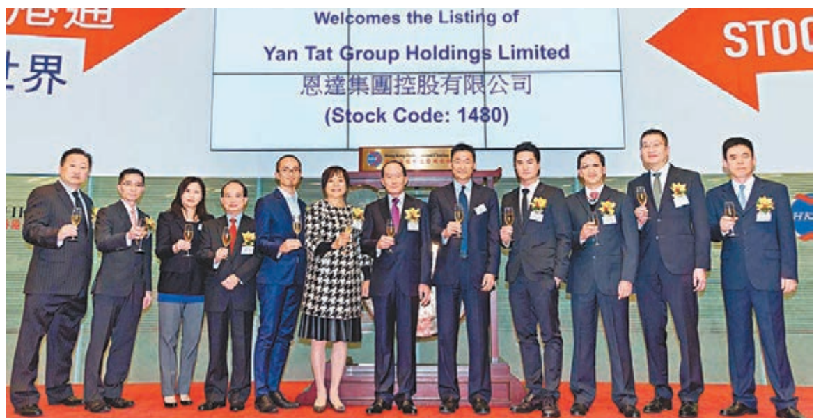
恩達昨日股價有如「瘋狂过山车」。圖為公司去年上市留影。