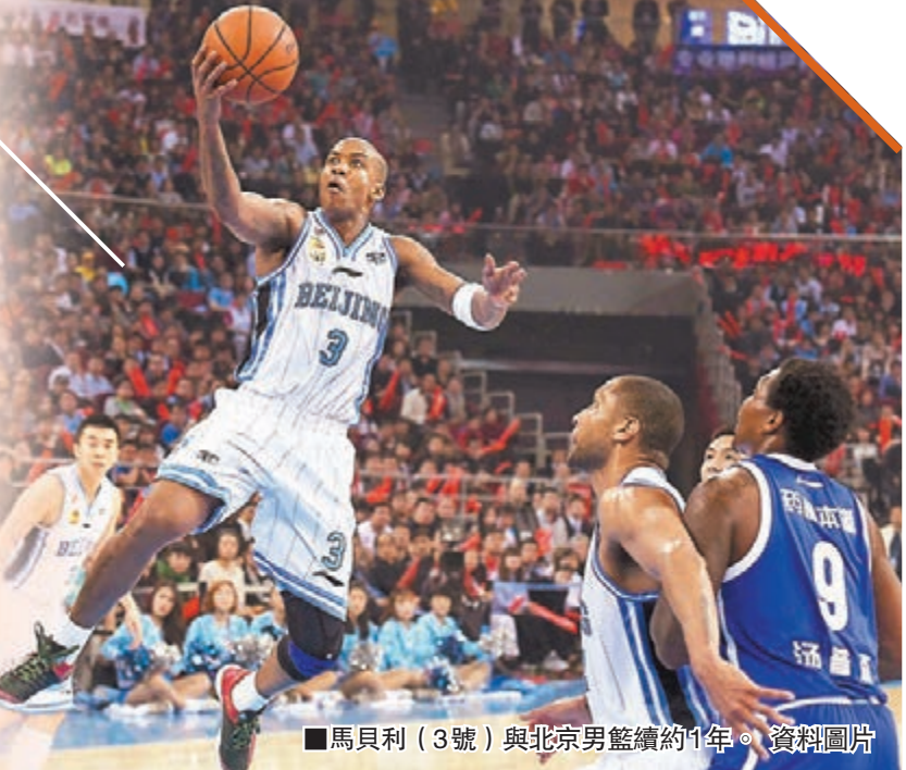
馬貝利(3號)與北京男籃續約1年。資料圖片

北京男籃主帥閔鹿雷昨作客一體育論壇時透露,現效力北京首鋼的前NBA球星馬貝利已和球隊續約一年。若無意外,馬貝利將在賽場馳騁至40歲。 2013年,馬貝利和北京隊續約3年(在原合同基礎上續約2年,共3年。也就是從2013-14賽季至2015-16賽季)。馬貝利當時表示,在合同到期後,無論首鋼讓他做甚麼他都會積極配合。 昨日,閔鹿雷作客一體育論壇時表示:「老馬又和我們續約了一年。如果一切正常,老馬還會打兩個賽季。」言外之意,就是若不出意外,現年38歲的馬貝利將為北京征戰至40歲。 對於外界擔憂馬貝利的狀態,閔鹿雷並不擔憂:「我們會合理地安排馬貝利的出場時間,讓馬貝利保持一個非常健康的狀態。」 與此同時,閔鹿雷還表示,他會挖掘國內球員的潛力,讓國內球員承擔更多的責任,從而幫助馬貝利分憂。