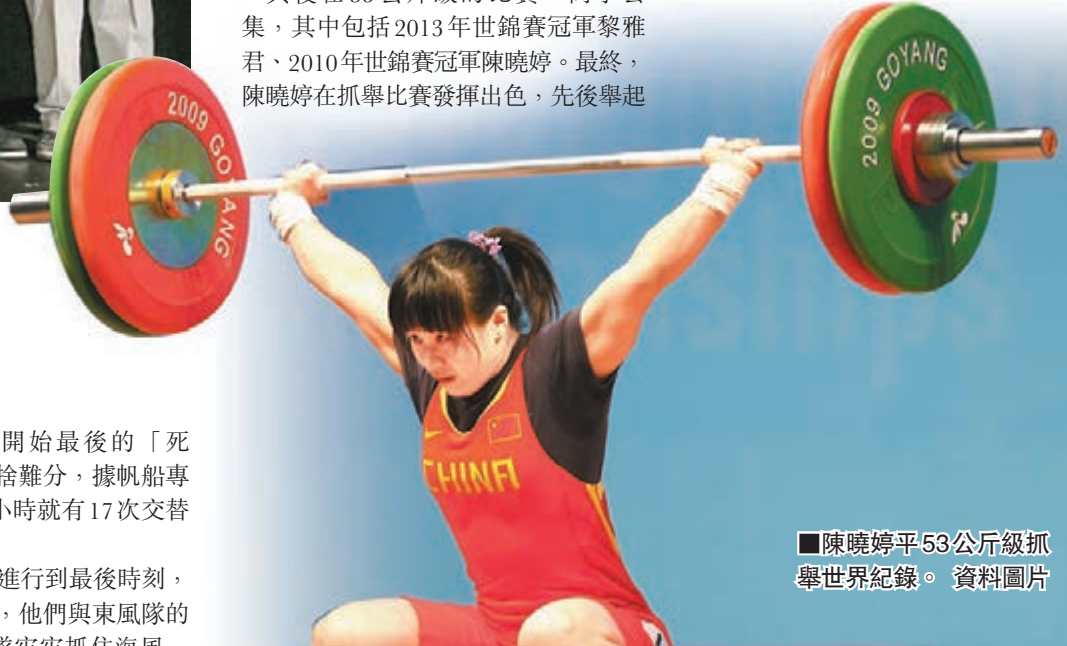
陳曉婷平53公斤級抓舉世界紀錄。資料圖片