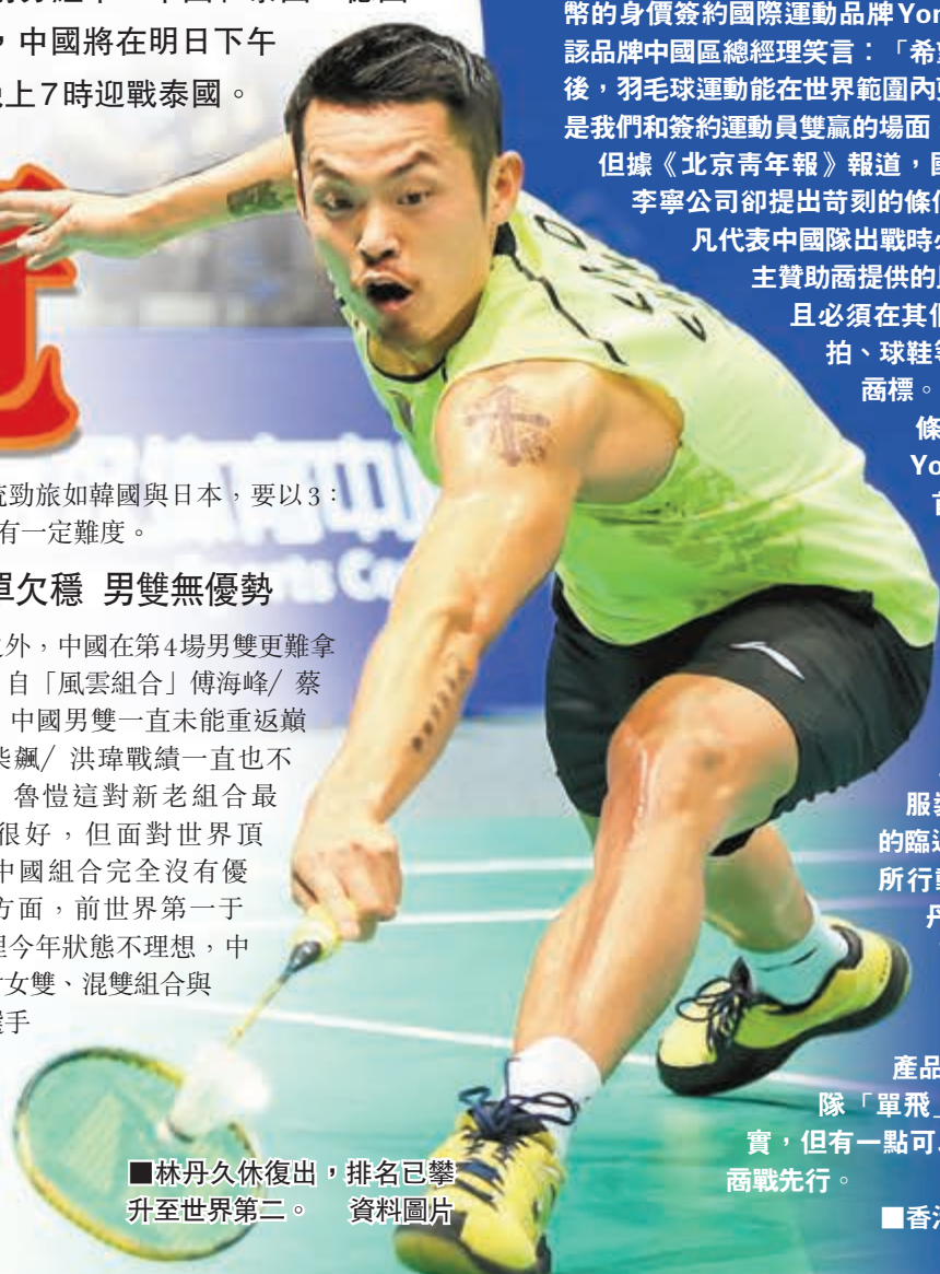
林丹久休復出,排名已攀升至世界第二。資料圖片

旦碰到傳統勁旅如韓國與日本,要以3:0淘汰對手有一定難度。 女單欠穩 男雙無優勢 除女單之外,中國在第4場男雙更難拿下決勝分。自「風雲組合」傅海峰/蔡賢拆檔後,中國男雙一直未能重返巔峰。儘管柴飆/洪煒戰績一直也不錯,蔡賢/魯愷這對新老組合最近表現也很好,但面對世界頂級組合,中國組合完全沒有優勢。女雙方面,前世界第一于洋/王曉理今年狀態不理想,中國隊的幾對女雙、混雙組合與世界一流選手當在伯仲之間,在大賽中能否頂住壓力,值得期待。