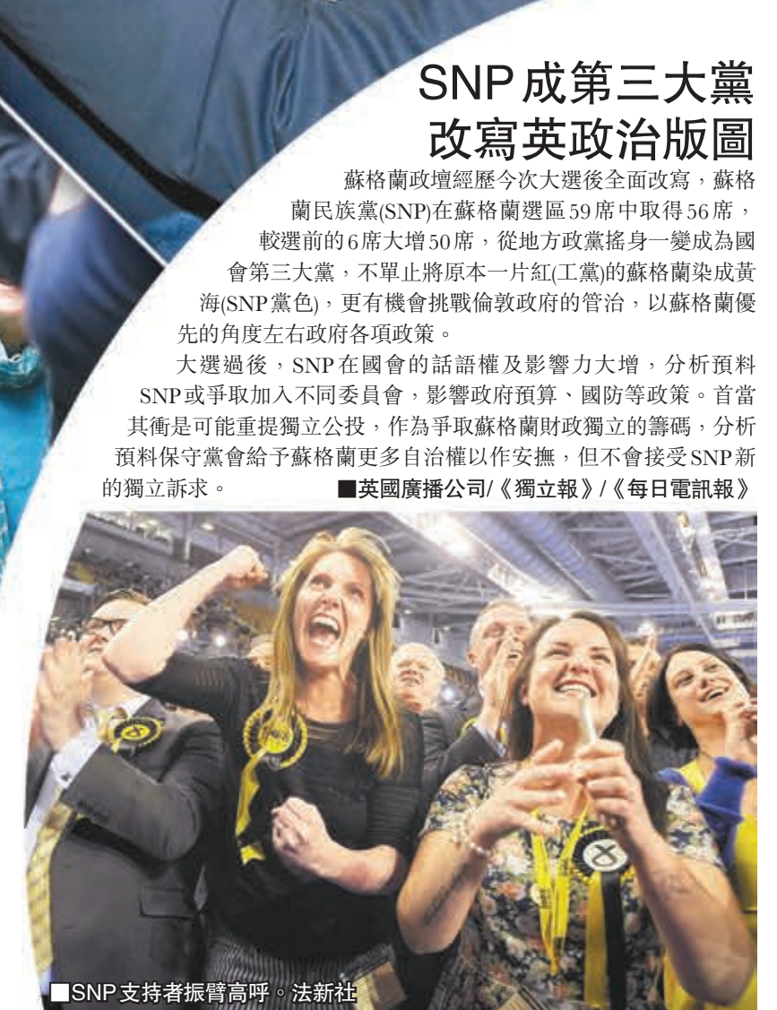
SNP支持者振臂高呼。