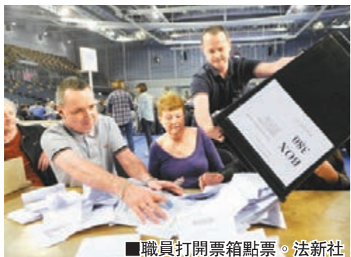
職員打開票箱點票。

專家指，今次選舉結果將令自民黨未來不敢再跟保守黨以至任何政黨合作執政，據報不少自民黨老臣子都認為該黨應該在野一段時間，重整旗鼓。