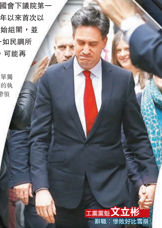
工黨黨魁 文立彬 辭職：慘敗好比雪崩

文立彬昨日對工黨大敗表示歉疚，又承認工黨需要強勁領導。他勉勵黨員不要絕望及沮喪，未來應討論如何重建工黨並奮力作戰。工黨副黨魁夏雅雯將擔任看守黨