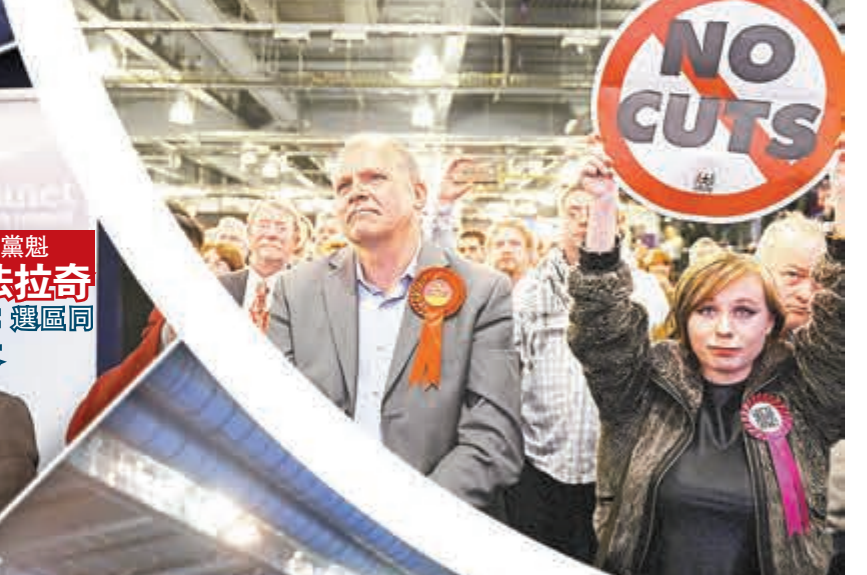
獨立黨黨魁 法拉奇 辭職：選區同侪落敗