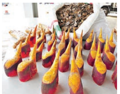
截獲的懷疑犀鳥嘴及穿山甲鱗片(後)。