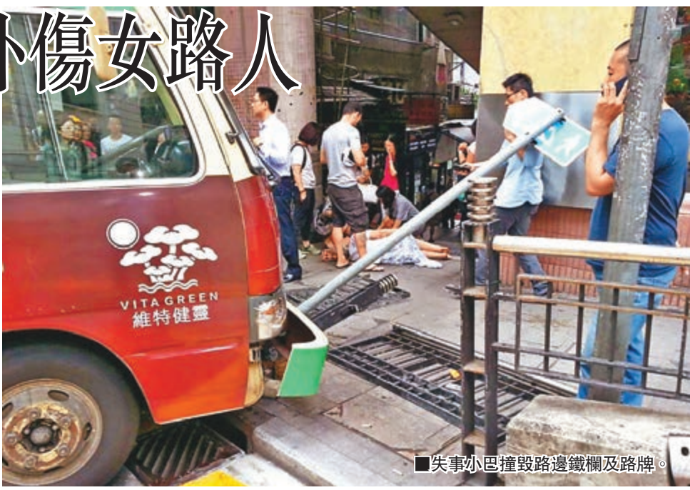
失事小巴撞毀路邊鐵欄及路牌。

傷員及救護員到場，迅將受傷婦人送院救治，小巴車上則無人受傷。有目擊者稱，幸當時小巴車速不算快，路人有時間走避，否則後果更加嚴重。肇事小巴司機事後通過酒精測試，由於他表示「無腳掣」致小巴失控，警方遂安排將失事小巴拖走檢驗，另正調查是否涉及人為因素導致事件發生。