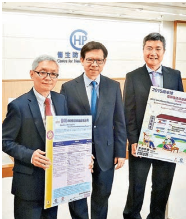
衛生防護中心今日起優先為院舍長者進行免費接種。

香港文匯報訊(記者 翁麗娜)為防範夏季有可能爆發變種甲型流感H3N2，港府斥資400萬元購入10萬劑南半球流感疫苗。衛生署衛生防護中心總監梁挺雄昨日公布，今日起展開「院舍防疫注射計劃」，優先為院舍長者進行免費接種。食物及衛生局局長高永文表示，根據疫苗可預防疾病科學委員會指引，曾接種季節性流感疫苗的人士，應相隔一段安全期才可接種疫苗。