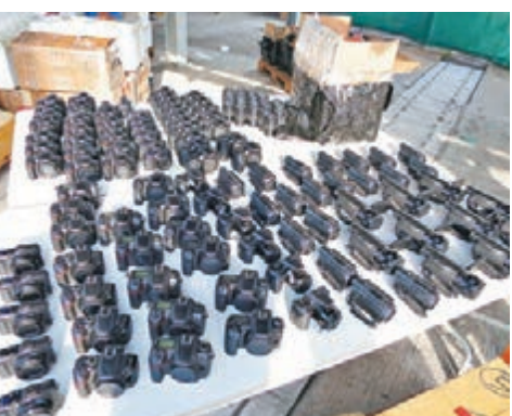
截獲的大批相機及攝錄機。