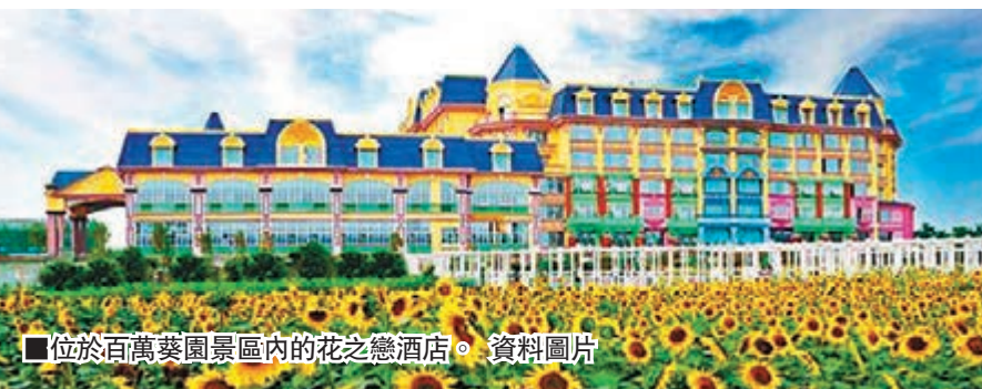
■位於百萬葵園景區內的花之戀酒店。

據天后宮工作人員介紹，這裡建築特點則集北京故宮的風格和南京中山陵的氣勢於一體，其規模是現今世界同類建築之最。