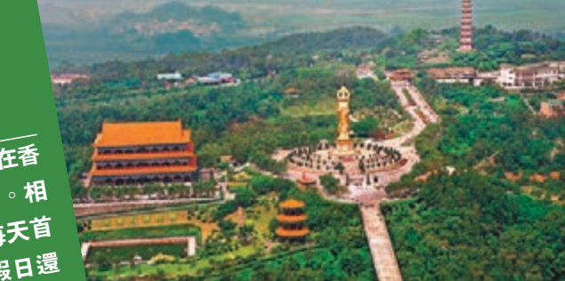
■「蓮峰觀海」景觀。資料圖片