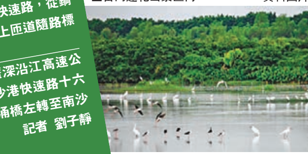
■南沙濕地公園的棲息鳥群。資料圖片