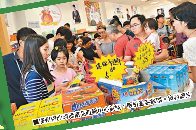
■廣州南沙跨境商品直購中心試業，吸引遊客瘋購。資料圖片